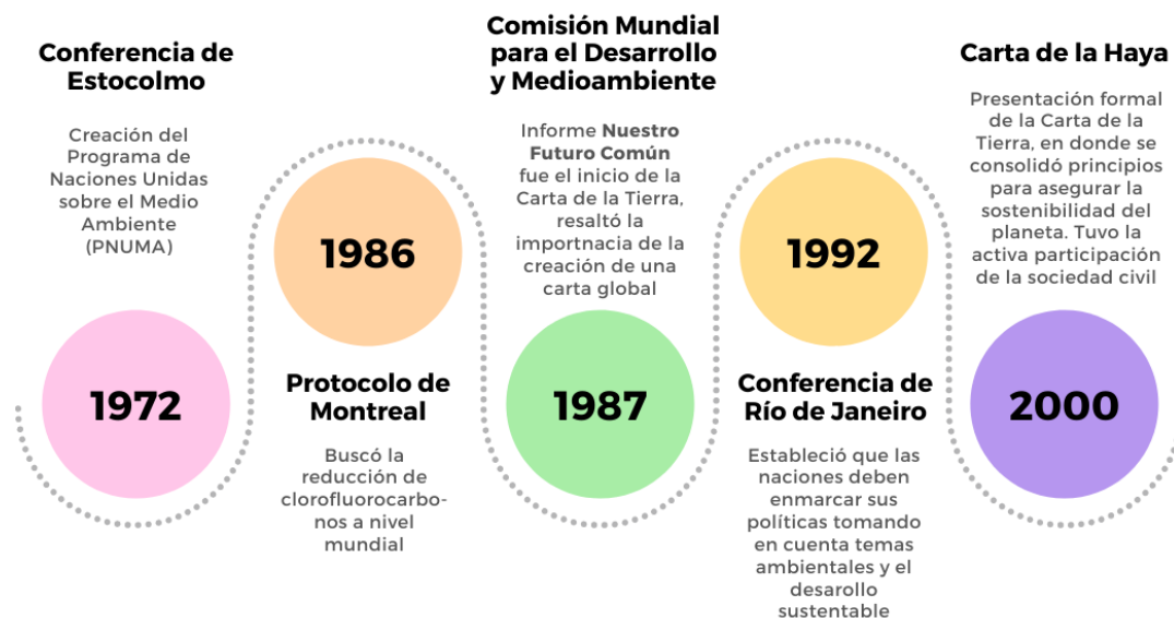
Tabla 1: esfuerzos internacionales que llevaron a la creación de la Carta de la Tierra

Fuentes: (Del Castillo, 2014; Becerra, 2005; Seara, 2005; Bosselmann & Taylor, s.f.; Mackey, s.f)