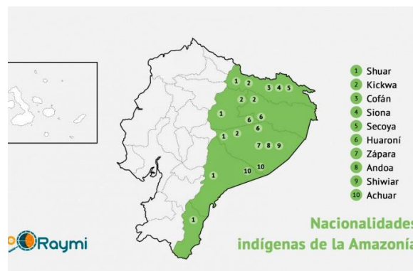
Ilustración 2: Nacionalidades indígenas de la Amazonía

La ubicación geográfica en donde se encuentra la nacionalidad Kichwa de la Amazonia son las provincias de Sucumbíos, Orellana, Napo y Pastaza; cabe resaltar que todos los pobladores de esta nacionalidad en esta zona tienen una lengua y cultura en común (Confederación de Nacionalidades de la Amazonía Ecuatoriana [CONFENAIE], s.f). De la misma manera, los kichwas amazónicos son considerados como la población indígena con más número de personas, con relación a las demás nacionalidades amazónicas ecuatorianas; en donde se establece que existen alrededor de 60 mil habitantes (Alvarado et al, 2012).