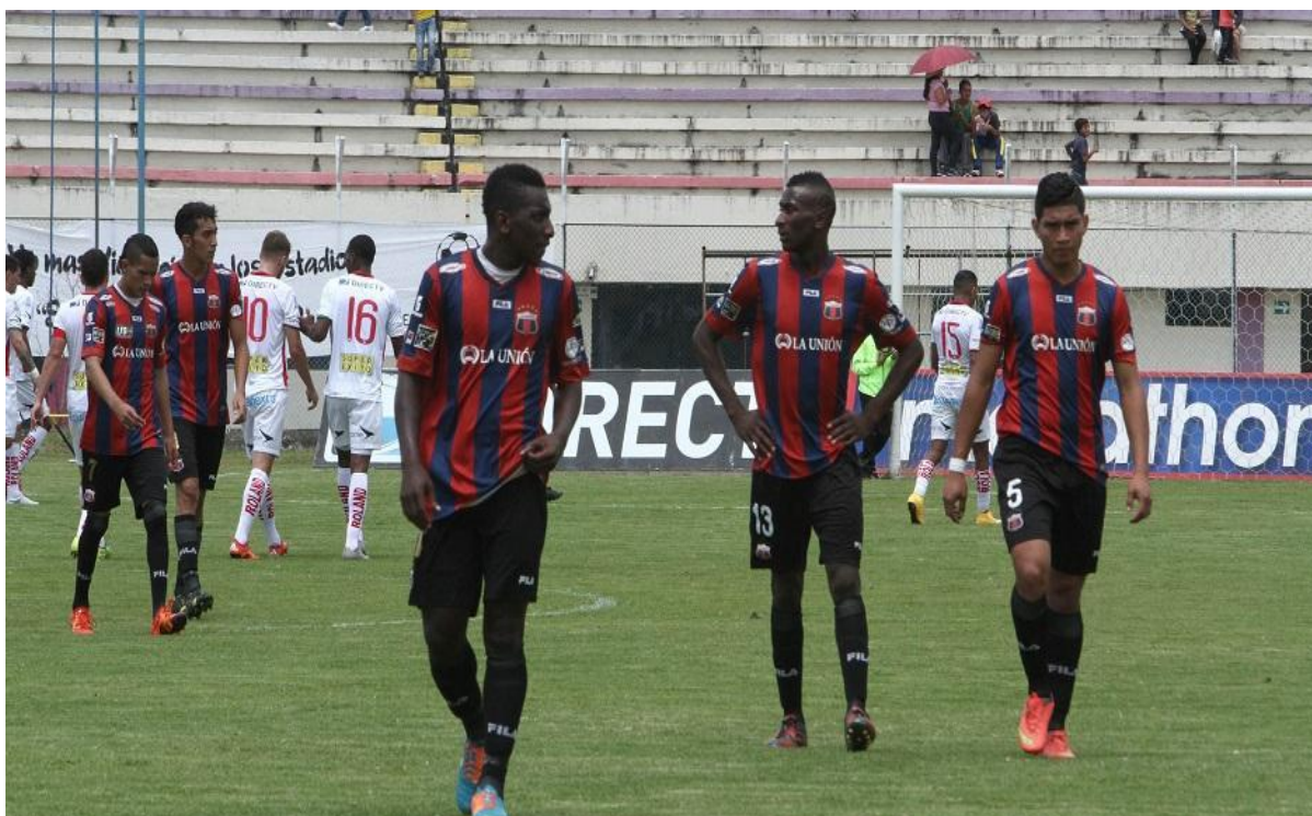
Figura 3: Sociedad Deportivo Quito, pierde la categoría, tras perder frente a Liga de Loja.

En el 2016, los problemas seguían y se volvieron a repetir, la Federación Ecuatoriana de Fútbol volvió a quitarle una gran cantidad de puntos a esta institución. Igual que un año atrás, la resta de puntos hicieron que el cuadro chulla descendiera a la Segunda Categoría del fútbol ecuatoriano (Sociedad Deportivo Quito, 2014).