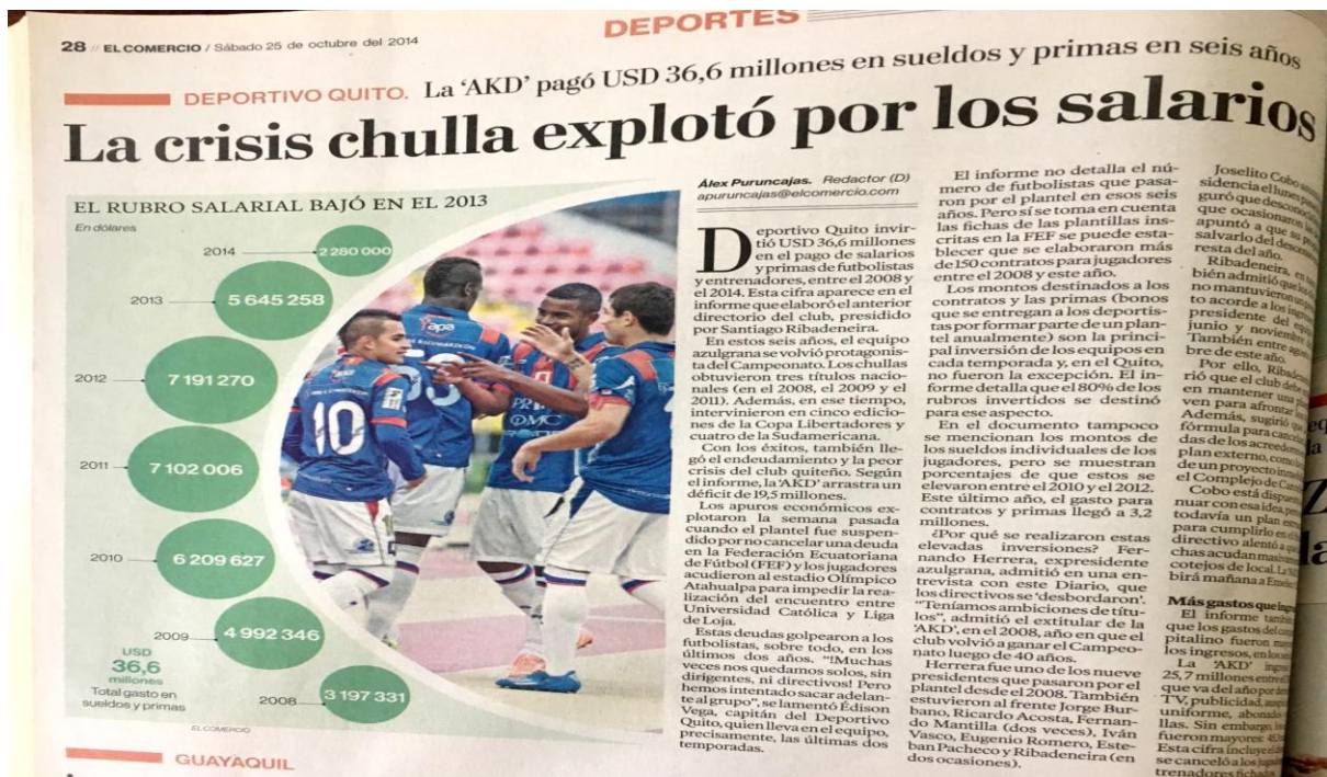
Figura 13: Noticia de El Comercio: “La crisis chulla explotó por los salarios”.

Todo lo contrario ocurre en el diario El Comercio , donde todas sus publicaciones de Sociedad Deportivo Quito poseen imágenes, lo que permite a los lectores entender de mejor manera el contenido de la noticia, cómo es el caso de la siguiente noticia: