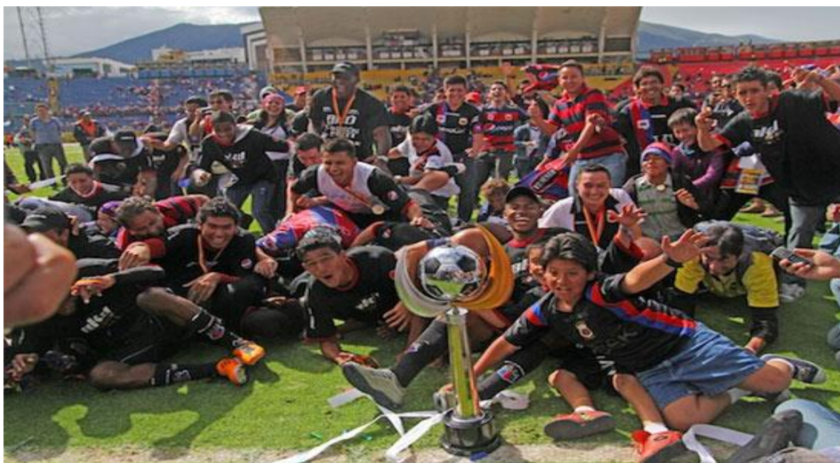
Figura 2: Sociedad Deportivo Quito campeón 2011.