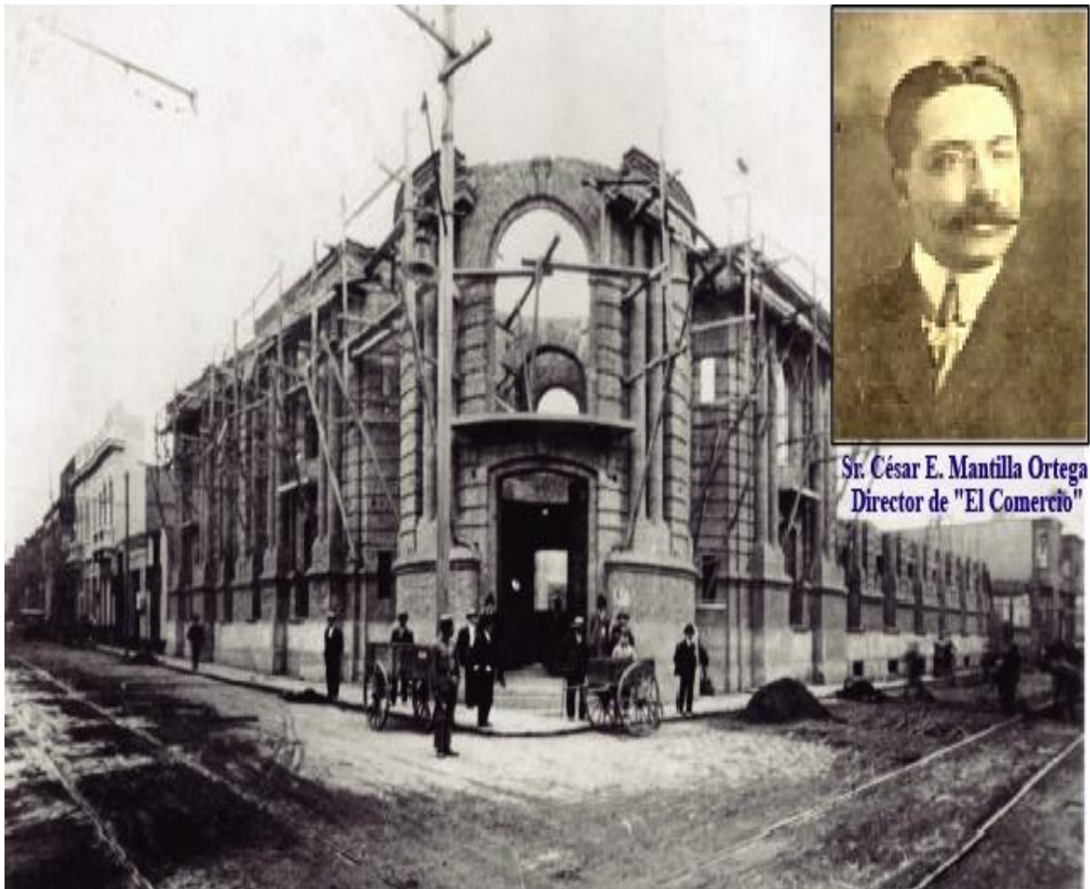
Figura 5: Instalaciones de El Comercio.

era suficiente, para distribuirlo de una manera adecuada y pueda contar con oficinas administrativas, salas de redacción, prensa y archivos. En noviembre de 1905, inauguraron la imprenta con las máquinas importadas y estaba previsto que para el otro año, El Comercio funcione con normalidad (Ribadeneira, 2006).