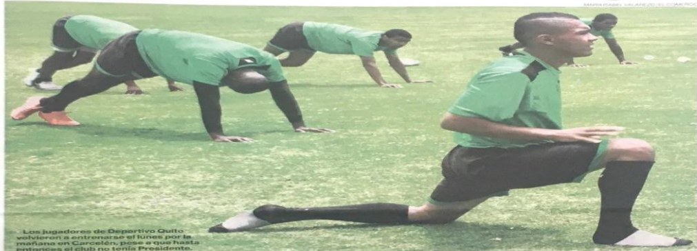
Los jugadores de Deportivo Quito volvieron a entrenarse el lunes por la mañana en Carcelén, pese a que hasta entonces el club no tenía Presidente.