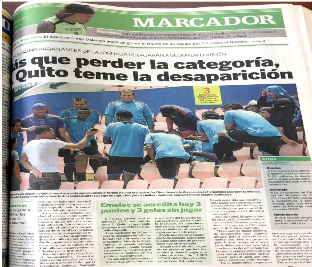
Figura 10: Noticia El Universo: “Más que perder la categoría, D. Quito teme la desaparición.

cuadro chulla, poseía un constante negativismo. Esto también se puede observar, cuando existen noticias de equipos de la sierra, en específico de la capital ecuatoriana, donde en su mayoría, este periódico usa titulares negativos para los elencos capitalinos, cuando son noticias de los equipos de Guayaquil, El Universo usa titulares positivos, brindándoles mayor importancia a estos planteles. Uno de los claros ejemplos de esto, se puede observar en la publicación del 19 de octubre de 2014, donde la editorial era la siguiente: