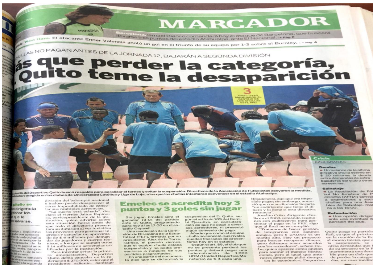
Figura 14: Noticia El Universo : “Más que perder la categoría, D. Quito teme la desaparición.”

En la última columna, se encuentran las fechas en que fueron publicadas las noticias: en El Comercio y El Universo . Existen varias noticias, donde coincide la fecha de publicación de los dos periódicos, pero a su vez, cada uno de estos diarios le da una diferente perspectiva a la crisis del Deportivo Quito. En el mismo día los periódicos publicaban diferentes noticias, El Comercio daba una perspectiva al asunto y El Universo brindaba uno completamente diferente. Cómo se puede observar el 19 de octubre de 2014, donde los dos medios de comunicación masiva publicaban lo siguiente: