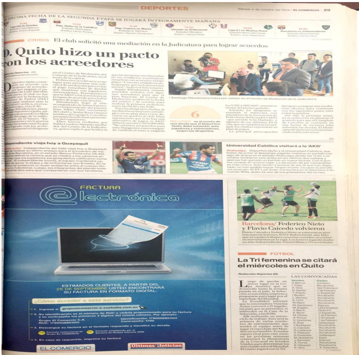
Figura 9: Noticia en El Comercio: “D. Quito hizo un pacto con sus acreedores”.

En la quinta columna, está situado la carga del titular, es decir si el titular es positivo o negativo. Este ítem es importante en el análisis, puesto a que se puede observar que importancia y el sentido que los diarios de comunicación más importantes del país le brindaban a las noticias.