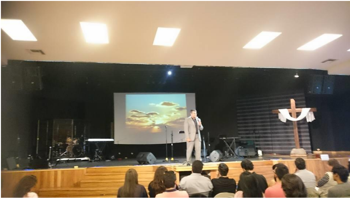
Iglesia Comunidad de fe