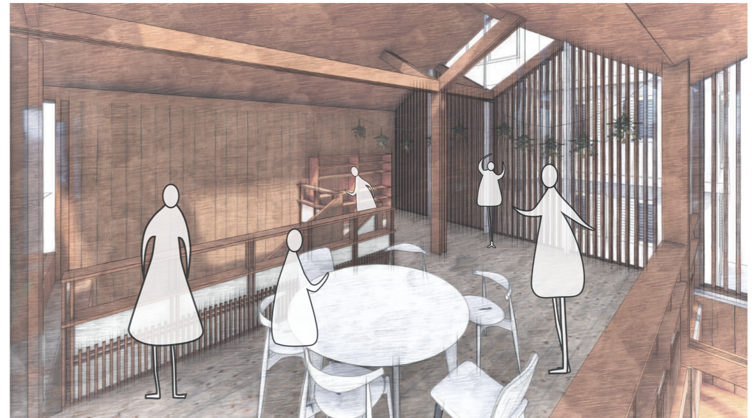
TALLER CON FLORES SECOS