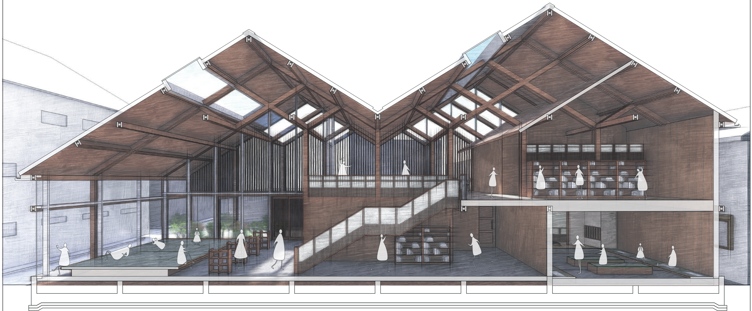
CORTE PERSPECTICO TIPO III

Pontificia Universidad Católica del Ecuador Facultad de Arquitectura, Diseño y Artes