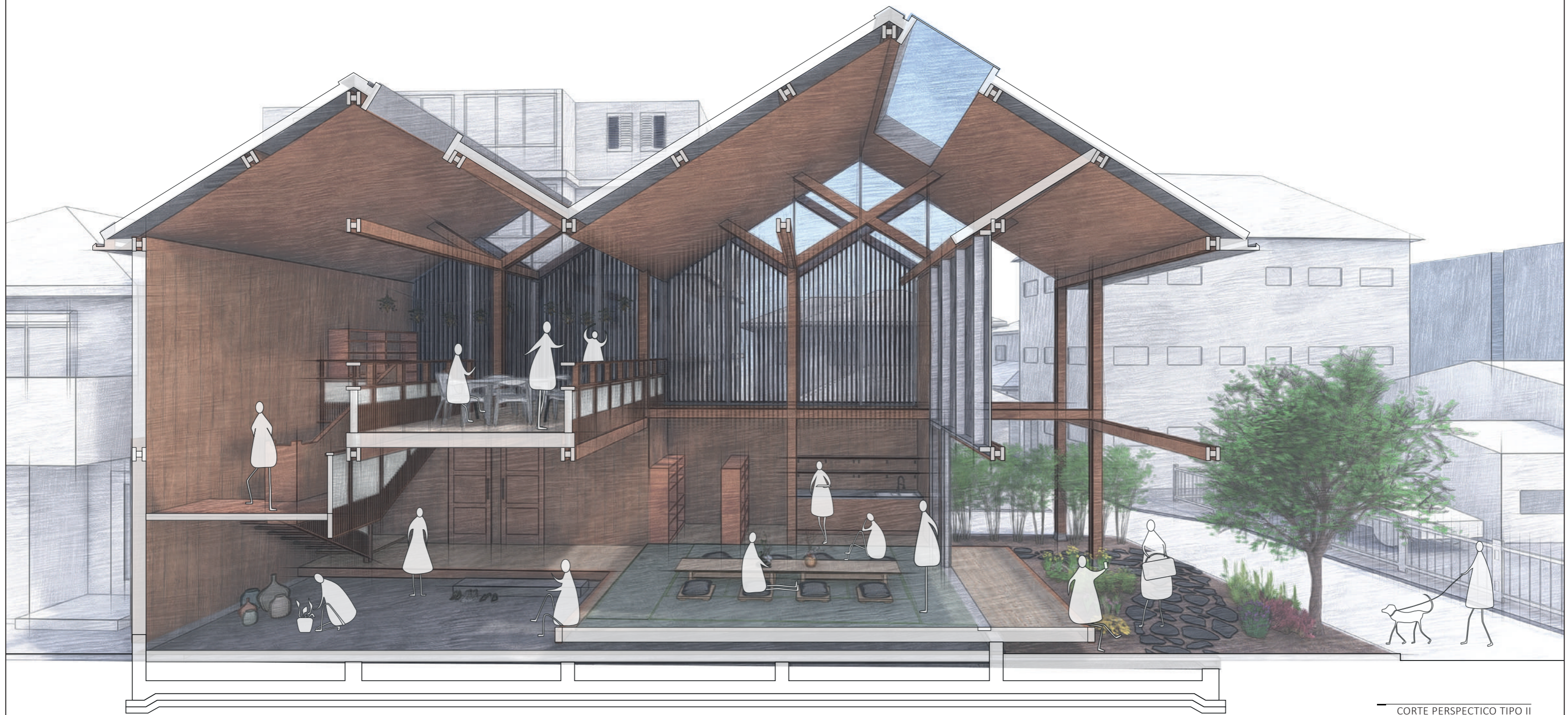
CORTE PERSPECTICO TIPO II

Pontificia Universidad Católica del Ecuador Facultad de Arquitectura, Diseño y Artes