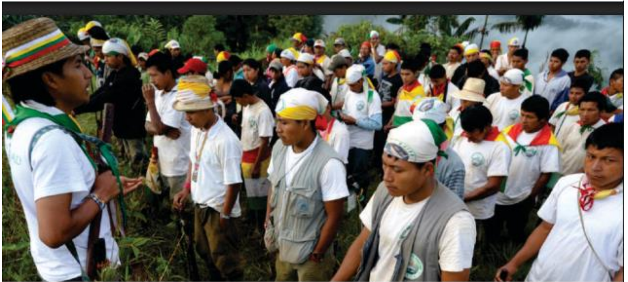
Fotografía de la guardia indígena posterior a la masacre de Tortugaña Telembí, marzo 2009.

defensa de la vida y el territorio. La masacre de Tortugaña Telembí se erige como un símbolo de la lucha por la justicia, la verdad y la reparación en el contexto del conflicto armado colombiano.