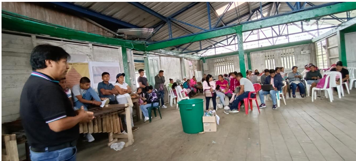
FOTOGRAFIA Predio El Verde municipio de Barbaocoas, 8 de octubre 2022

A pesar de ser los Awá un grupo indígena comparativamente numeroso- alrededor de 22.000 personas-, su proceso histórico de resistencia se ha caracterizado por la dispersión de sus comunidades en territorios selváticos de difícil acceso y la invisibilización su cultura como mecanismo de protección. Es solo a partir de los años ochenta que se inicia un proceso de movilización y organización, que se concreta en la década de los noventa, con la “Asociación de autoridades tradicionales del pueblo indígena Awá- UNIPA- Unidad Indígena del pueblo Awá”, que surge como respuesta a los cada vez más frecuentes casos de abusos sobre los territorios ancestrales ejercidos por las nacientes y expansivas empresas palmicultores y camaroneras en el municipio de Tumaco. Es con este proceso organizativo que plantean cuatro pilares fundamentales que rigen la vida organizativa: “UNIDAD, TERRITORIO, CULTURA Y AUTONOMÍA”.