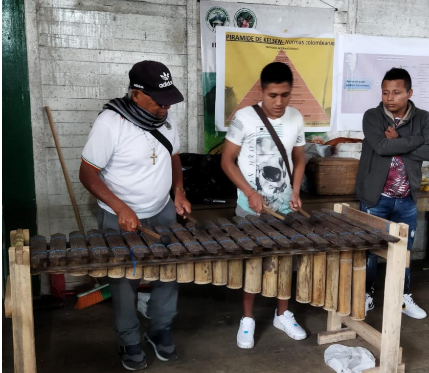
Fotografía Predio el Verde, Resguardo del Gran Sábalo, Barbacoas 8 de octubre del 2022.

Este tipo de prácticas evidencia una profunda conexión entre la autonomía cultural y la preservación de los saberes ancestrales, que son cruciales para la pervivencia de la comunidad. El saber cuándo y cómo utilizar los recursos naturales es una forma de mantener su identidad intacta, al mismo tiempo que se asegura la sostenibilidad ambiental. Este conocimiento empírico, heredado de generación en generación, no solo tiene un valor cultural, sino que también ofrece soluciones prácticas para el manejo de los recursos en un mundo en el que la explotación indiscriminada ha causado severos daños ecológicos. Como por ejemplo la limitación de zonas netamente para pan coger con, zonas de protección, sitios sagrados primordiales para la existencia del bosque húmedo y tropical que rodea al pueblo Awá.