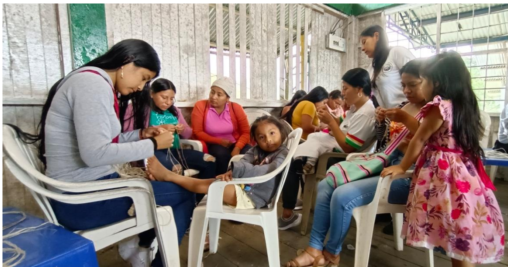
FOTOGRAFIA Predio El Verde, Resguardo del Gran Sábalo, 1 de octubre 2022

han liderado procesos de reconciliación y han sido defensoras incansables de los derechos humanos. Su rol ha sido vital para mantener la cohesión de la comunidad y para garantizar que, a pesar de la violencia, los Awá sigan luchando por su autonomía y por un futuro más pacífico para las generaciones venideras.