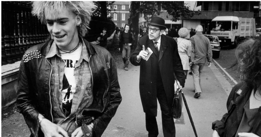
Figura 1. Exclusión de vestimenta al estilo punk. Tomado de: National Geographic, 2022.

Para Dimitrova (2015), el punk es un modo de vivir que cuenta con condiciones sociales, políticas y económicas difíciles, de la exclusión, la desigualdad, la injusticia, la crisis proveniente de las inestabilidades de cada nación; un modo de vivir que ha sido relacionado por la sociedad y el mundo entero con ladrones y satánicos. Un movimiento percibido como ajeno a la cultura. (Figura 1)