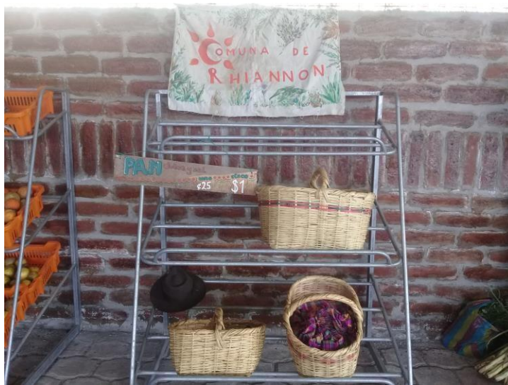
(Malchinguí, 2017). Diario de Campo. Malchinguí.