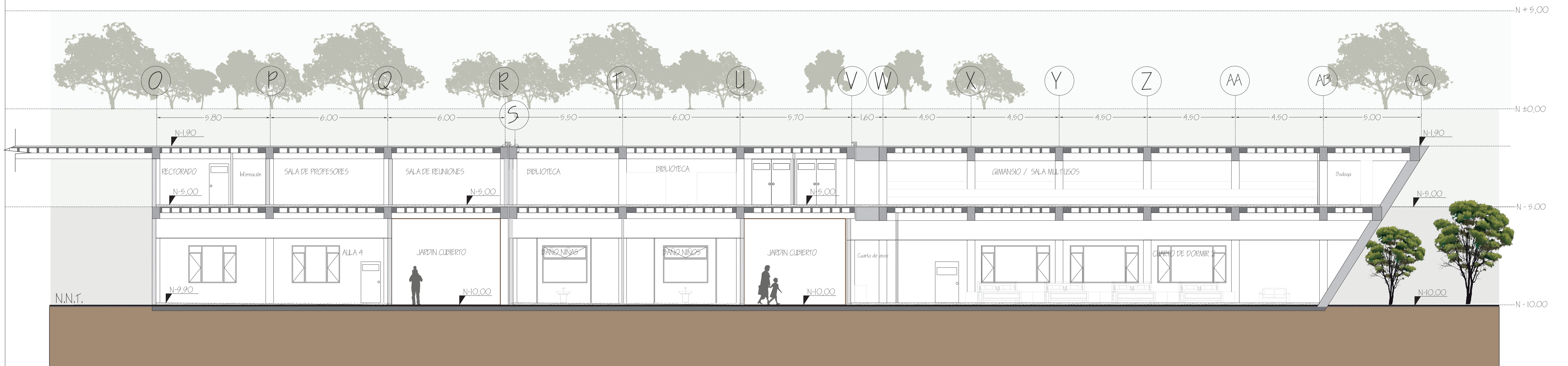
CORTE B - B' ESC 1:100

PONTIFICIA UNIVERSIDAD CATOLICA DEL ECUADOR FACULTAD DE ARQUITECTURA, DISEÑO Y ARTES TRABAJO DE FIN DE CARRERA