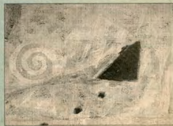
Uno de los trabajos de Dorkas Gelabert