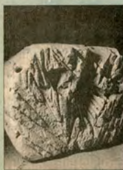
Escultura de Patricia Piccone

En todo el país está en marcha una campaña para lograr un cambio de actitud frente a la niñez