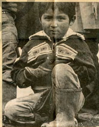
Muchos niños viven en condiciones especialmente difíciles

Millones de niños viven en condiciones especialmente difíciles: huérfanos y niños de la calle, refugiados o niños desplazados, víctimas de la guerra y de los desastres naturales o provocados por el ser humano, hijos de trabajadores migratorios y otros grupos sociales en situación desventajosa, niños trabajadores o sometidos al yugo de la prostitución, el abuso sexual u otras formas de explotación.