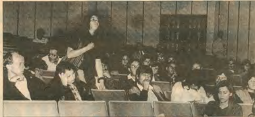
Participantes en el panel que analizó el reciente "Salón de Escultura Mariano Aguilera"