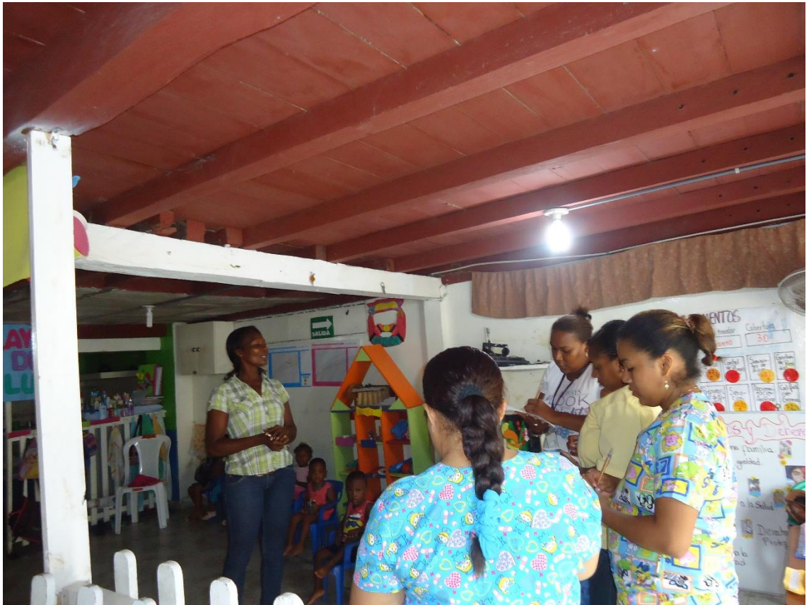
Imagen 5 Detalle de explicación de los objetivos de la investigación