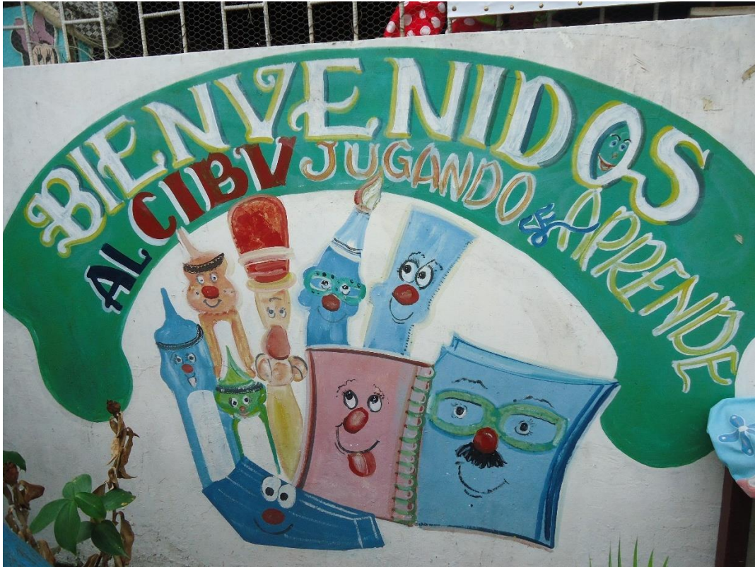
Imagen 3 Cartelería del CIBV Jugando se Aprende