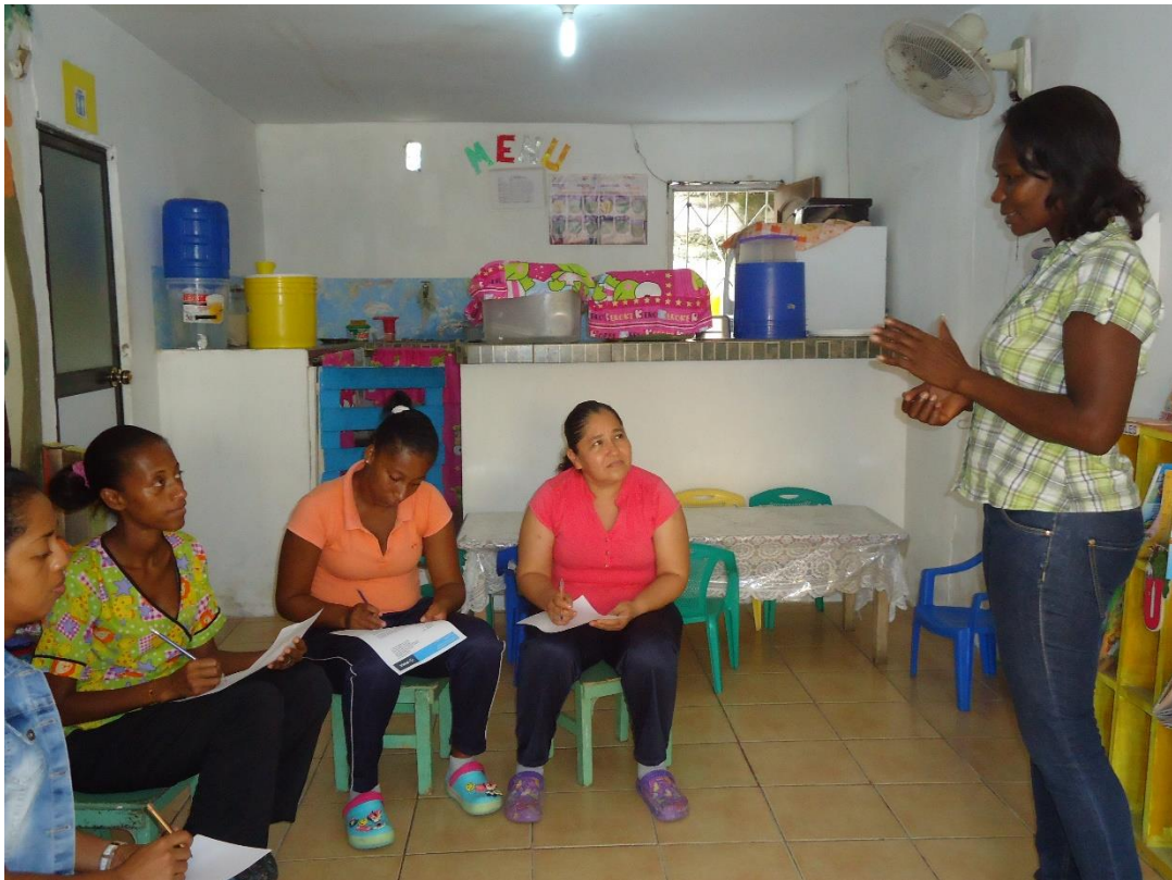
Imagen 4 Detalle de realización de las encuestas.