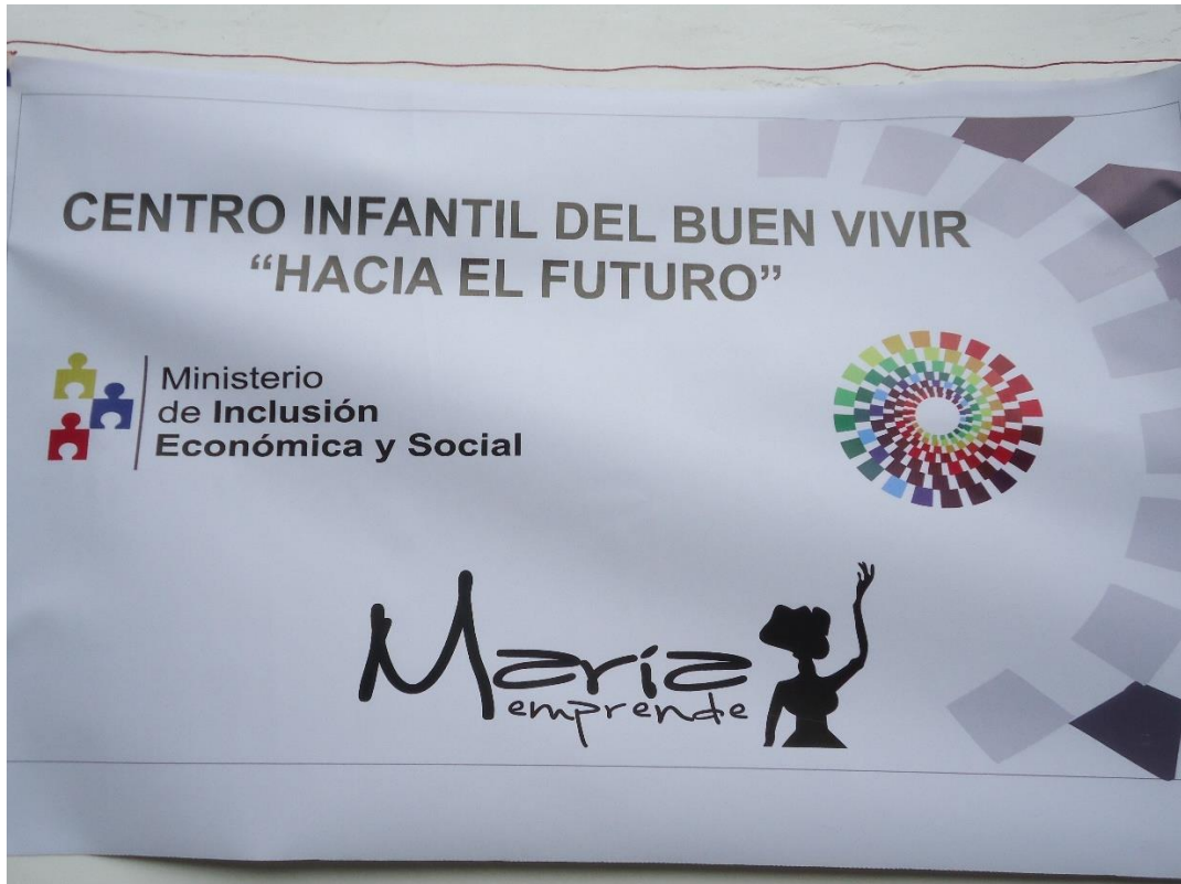
Imagen 1 Cartelería del CIBV Hacia El Futuro