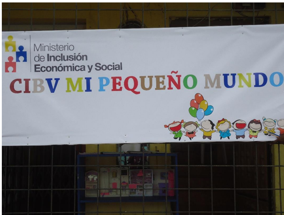
Imagen 2 Cartelería del CIBV Mi Pequeño Mundo