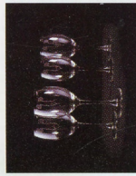
juego de copas