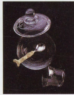
salero y azucarero