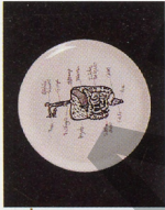
plato servilto grande