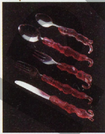
juego de cubiertos