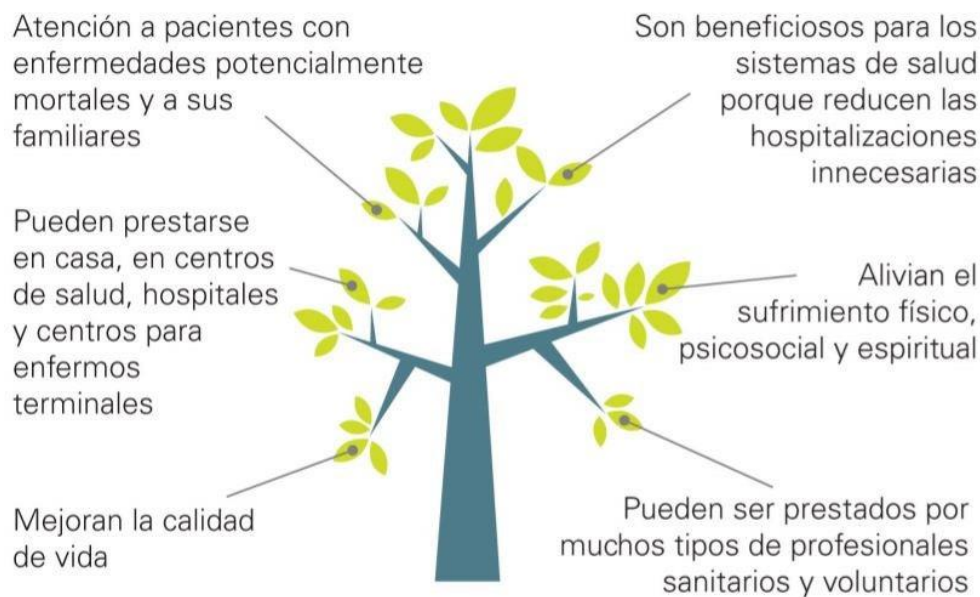
Figura 2. Los cuidados paliativos según la OMS, (s.f.)

En pocas palabras los cuidados paliativos significan “paliar el dolor” frente a una enfermedad que no tiene cura”, busca mitigar el dolor y otros síntomas desde el primer momento del diagnóstico hasta la etapa final de vida del paciente, así como el de la familia. Entrar en cuidados paliativos no significa el fin, sino el inicio del cambio hacia una muerte digna brindando acompañamiento, asegurando confort y dignidad hasta el último aliento.