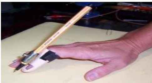
ANEXO 3: FERULA PARA FACILITAR LA ESCRITURA