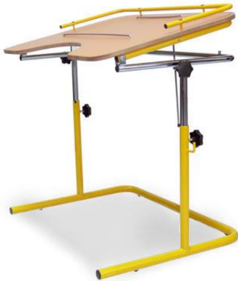
ANEXO 1: MESA ADAPTADA PARA ALUMNO CON DISCAPACIDAD MOTORA