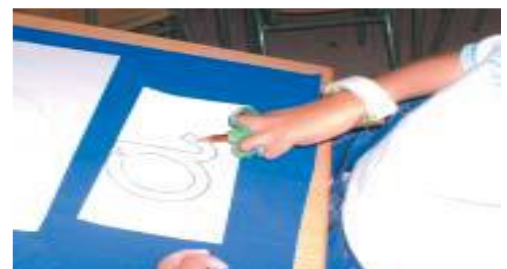
ANEXO 6: MESA ADAPTADA Y FÉRULA PARA DIBUJAR