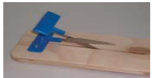
ANEXO 4: FIJACIÓN DE LA TIJERA