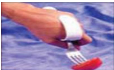
ANEXO 5: ADAPTACIÓN DE CUBIERTO PARA COGER LOS ALIMENTOS