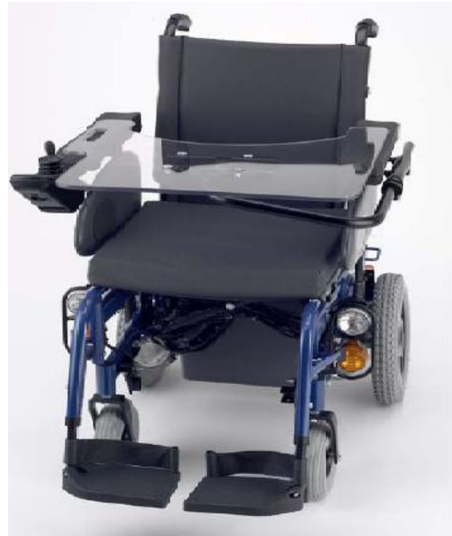
ANEXO 2: SILLA DE RUEDAS CON ADAPTACIONES PARA ESTUDIANTES CON DISCAPACIDAD MOTORA