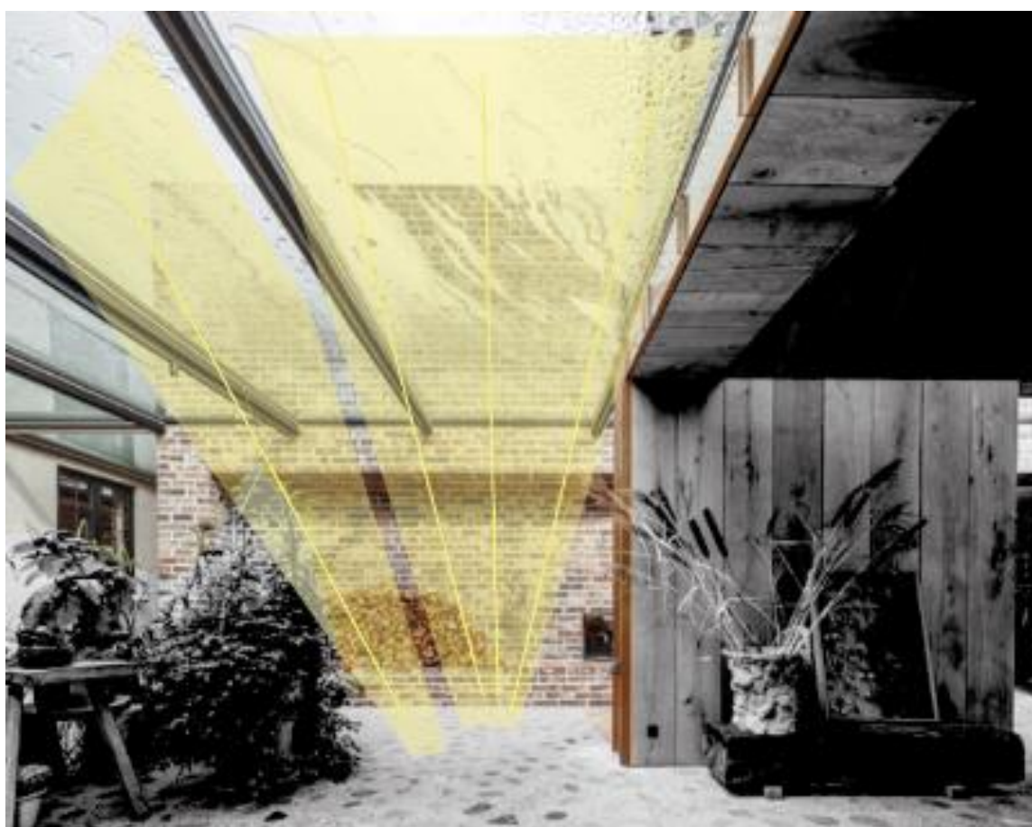
Ilustración 8 (Hjortshoj, ARCHITONIC, s.f.)