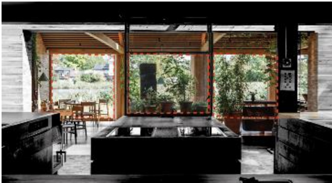
Ilustración 6 (BIG, 2022)

El uso de formas orgánicas y naturales tanto en los espacios como en los elementos arquitectónicos que adornan cada parte del proyecto, el uso de líneas fluidas y curvas suaves o con el uso de formas inspiradas en la naturaleza con las cuales pueden mostrar al usuario la comunicación del interior exterior que fue pensadas para la armonía con el entorno, como se aprecia en la ilustración 6, en la cual se puede observar el juego de formas y la relación del espacio exterior con el interior