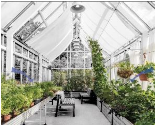
Ilustración 2 (Hjortshoj, ARCHITONIC, s.f.)