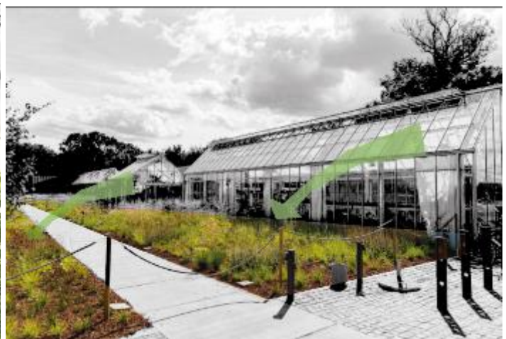
Ilustración 3 (Hjortshoj, ARCHITONIC, s.f.)