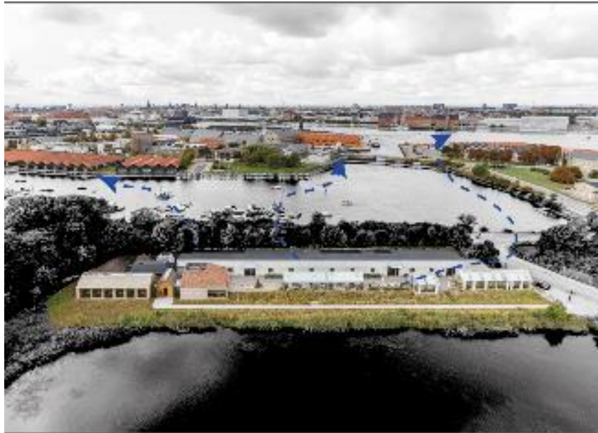
Ilustración 4 (Hjortshoj, World-architect.com, s.f.)

El uso de materiales provenientes de la región y recursos locales lo que ayuda a reducir la huella de carbono asociada con el transporte de materiales de larga distancia y el poder integrar elementos que formen parte de la identidad y la cultura local en la cual se crea una cultura más profunda con el entorno, como se puede observar en la ilustración 5