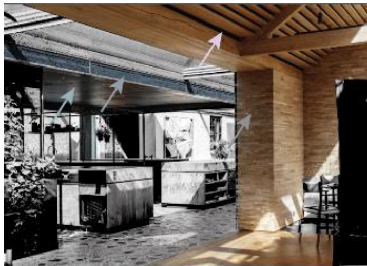
Ilustración 5 (Hjortshoj, ARCHITONIC, s.f.)