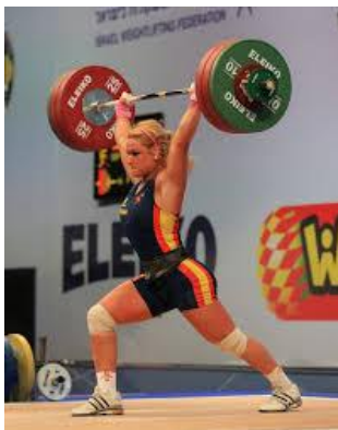
Figura 2. Halterofilia: Modalidad Envi3n.