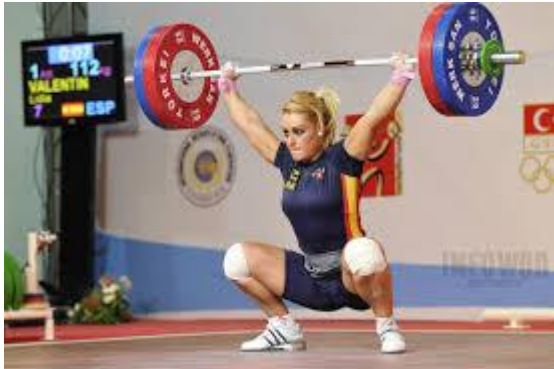
Figura 1. Halterofilia: Modalidad Arranque.

La combinación distintiva de fuerza muscular, potencia muscular, flexibilidad, conciencia kinestésica y técnica de levantamiento necesaria para el desempeño exitoso del levantamiento de pesas resulta en un perfil fisiológico único (Fry et al., 2006).