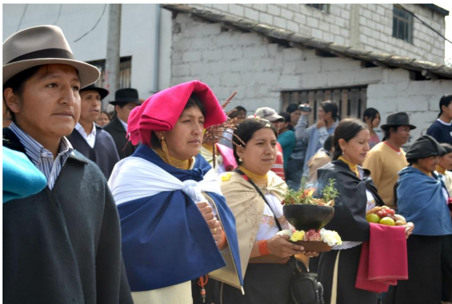
Gráfico 6. Otavalos (Peguche).

Los Otavalos son trabajadores, modestos, orgullosos de sus tradiciones, atentos con propios y extraños, apegados a sus costumbres y, a la vez, cultivador de las mismas.