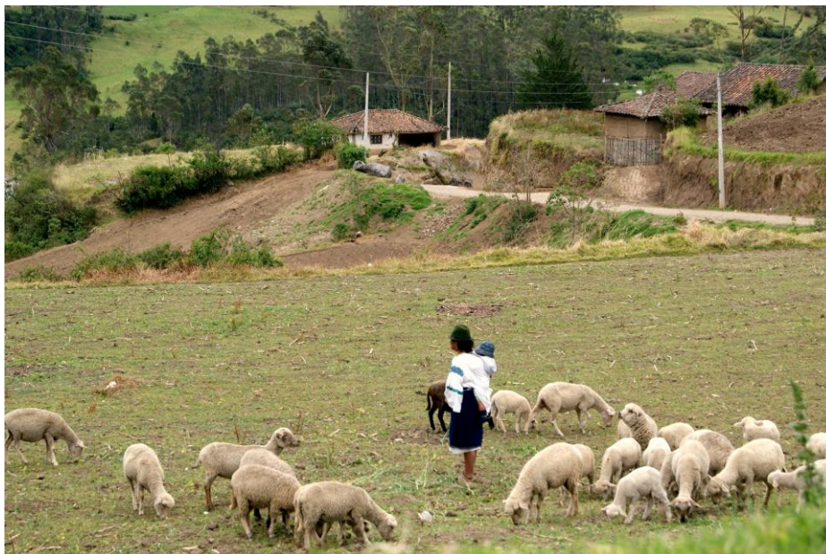
Gráfico 8. Kayambis (La Rinconada).

El Pueblo Kayambi es un pueblo con una economía en transición. Tienen una historia propia que había resistido por más de dos décadas a los Incas. Una historia musical, con su propio ritmo, llamado XUAN, ritmo que en la invasión y conquista española le llamaron Juan y, por influencia de la Iglesia, se le denominó Sanjuanito. Se llamaba XUAN porque los Aruchis marcan el paso al ritmo del Xuan... Xuan... xuan. Sin embargo, el Sanjuanito cayambeño es propio de este pueblo.