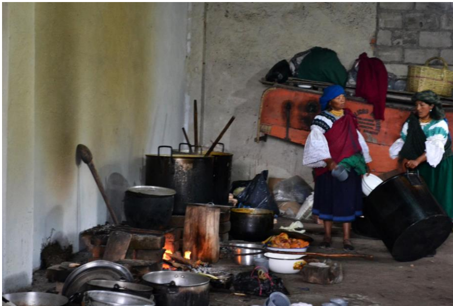
Gráfico 7. Karankis (La Magdalena).

“Los Karanki provenían de un pueblo ancestral que existía en Imbabura, son descendientes de un pueblo originario que posee un espacio físico donde habitó” (Farinango, 2012).