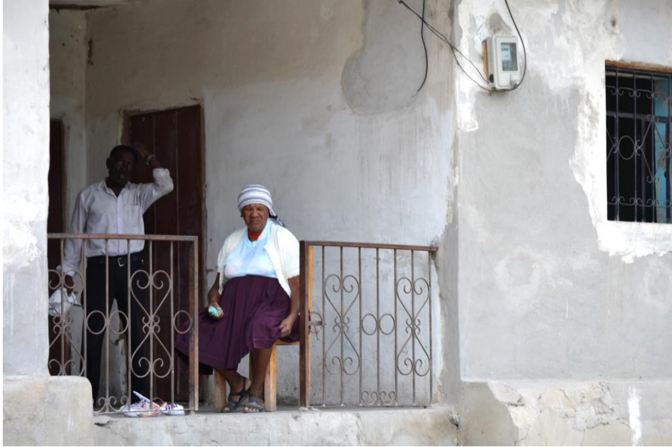
Gráfico 3. Afroecuatorianos (El Chota).