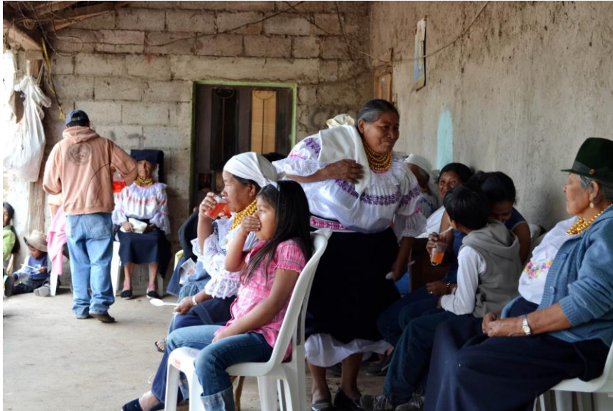
Gráfico 5. Natabuelas.