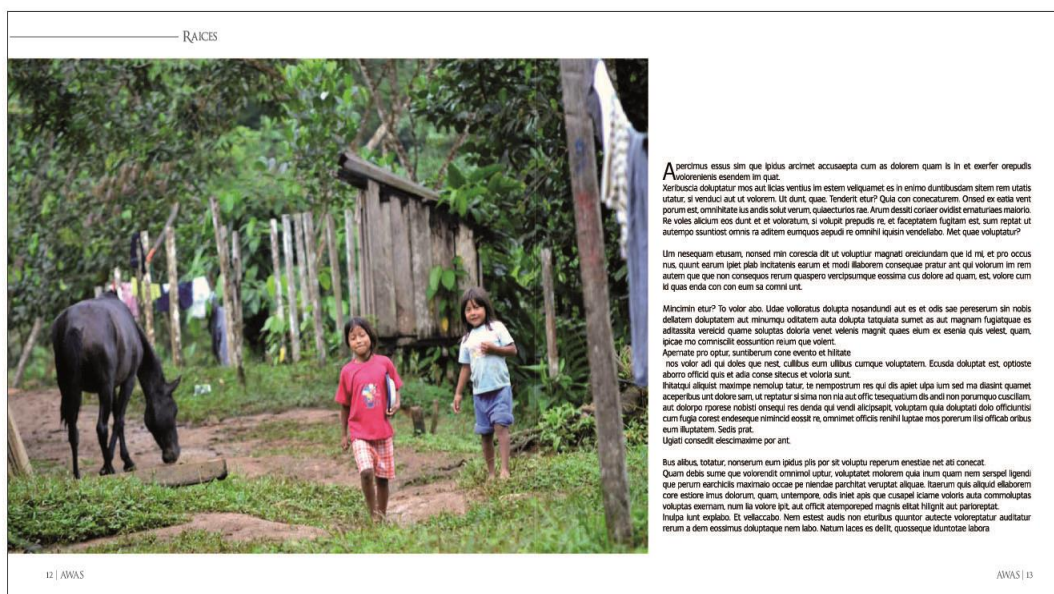
Gráfico 2. Maquetación libro.

La diagramación que llevará el libro también tiene relevancia, ya que debe facilitar la lectura, brindando al lector los espacios adecuados para que el ojo pueda descansar y exista fluidez en el desarrollo de la lectura a través del libro. Para esto, se realizó una encuesta en donde se buscaba identificar el tamaño adecuado del libro y el uso de texto e imágenes. Además se hizo, un análisis en libros con las mismas características para resaltar detalles y patrones repetitivos que se puedan aplicar en esta propuesta.