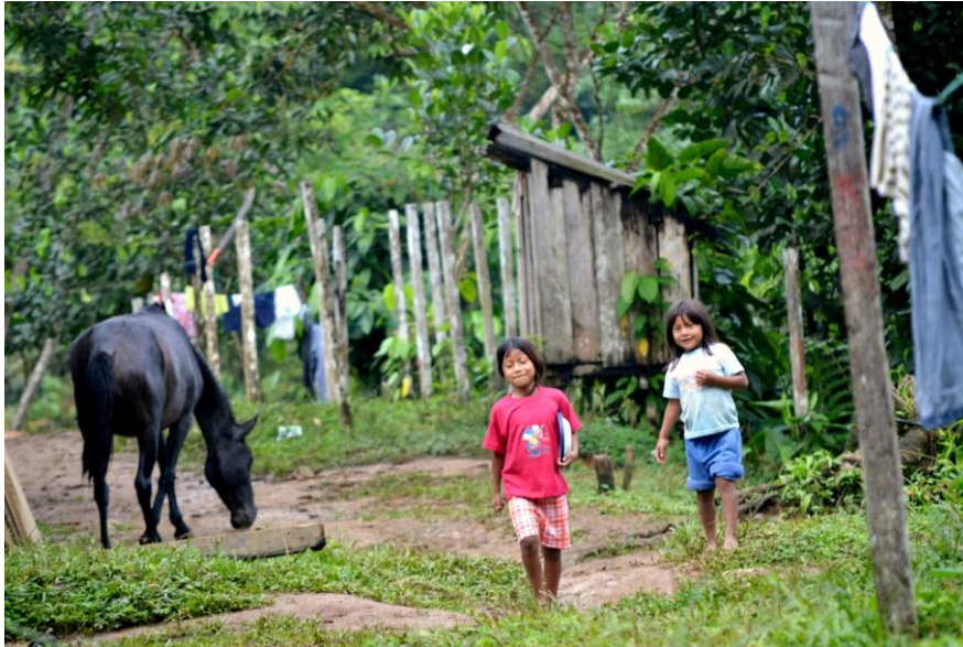
Gráfico 4. Awás.