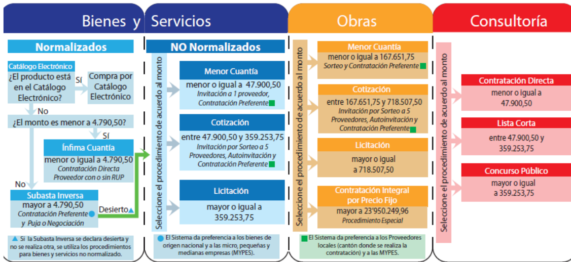
Gráfico 1. Montos y Tipos de Contratos