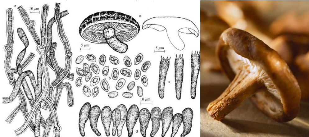
Hongo Shiitake [ L. edodes (Berk.) Singer]. a) Cuerpo Frutífero, b) Esporas, c) Basidio, d) cheilocystidia, e) elementos de la cutícula. Mushrooms grower's Handbook 2.