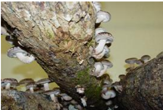
.Shiitake cultivado en roble.

Esta forma de cultivo comprende principalmente a la inoculación de esporas en trozos de madera de Chinquapín o roble japonés. Actualmente se ha ampliado la gama de sustratos incluyendo la madera de otras especies como el roble o eucaliptos que se obtiene al cortar árboles en pie, en troncos de una longitud que puede variar de entre los 1.0 a 1.2m. y un diámetro que va desde los 10 a 15cm. Estos troncos son los que finalmente son inoculados con el hongo mediante agujeros en su corteza donde se deposita el micelio del hongo.