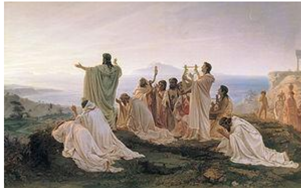
“Grupo de pitagóricos celebrando la salida del sol”. Óleo de Fyodor Bronnikov, (1827-1902).

Esta imagen está en el dominio público pues su derecho de autor ha expirado. Disponible en: http://john-petrov.livejournal.com/939604.html?style=mine#cutid1