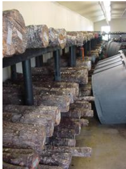
Troncos inoculados con shiitake.