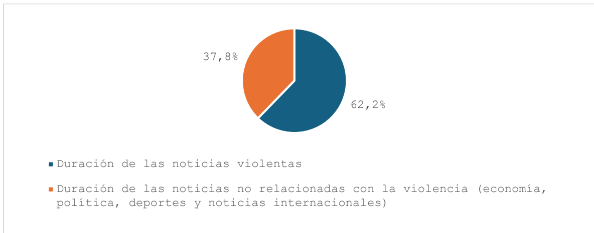
Porcentajes del tiempo de las noticias El Noticiero III. 19 de mayo 2025