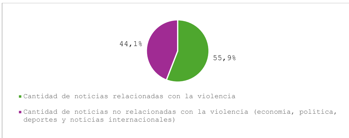
Porcentajes de distribución de noticias El Noticiero III. 19 de mayo 2025