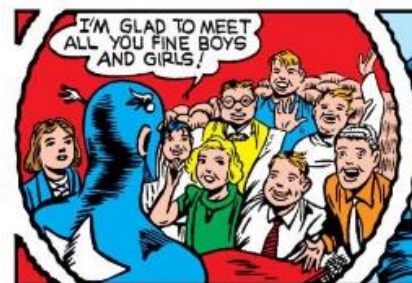
Figura 13. Simon, Joe & Kirby, Jack, Captain America #6 , p. 14 (agosto, 1941), republicado en Marvel Entertainment Inc., 2009. Recuperado de: https://comicstore.marvel.com/my-books/lists