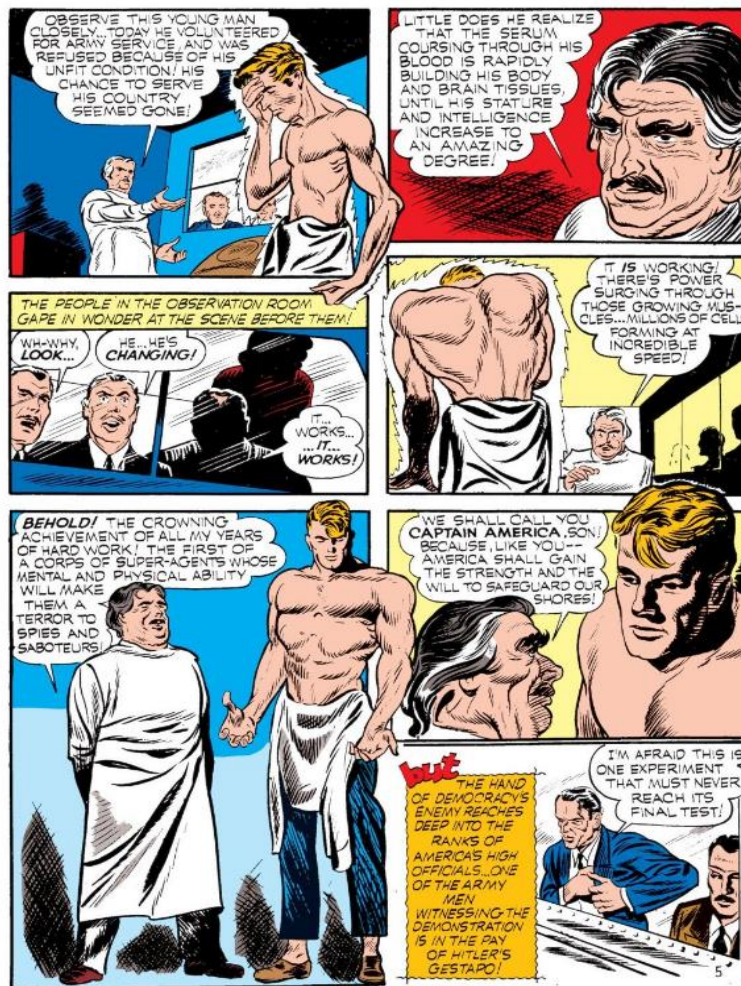
Figura 6. Simon, Joe & Kirby, Jack, Captain America #1 , p. 7 (marzo, 1941), republicado en Marvel Entertainment Inc., 2009. Recuperado de: https://comicstore.marvel.com/my-books/lists

Pero antes de ello, es importante pasar a la siguiente página de la historieta, donde Simon y Kirby nos siguen contando el proceso de transformación de Steve Rogers en Capitán América: