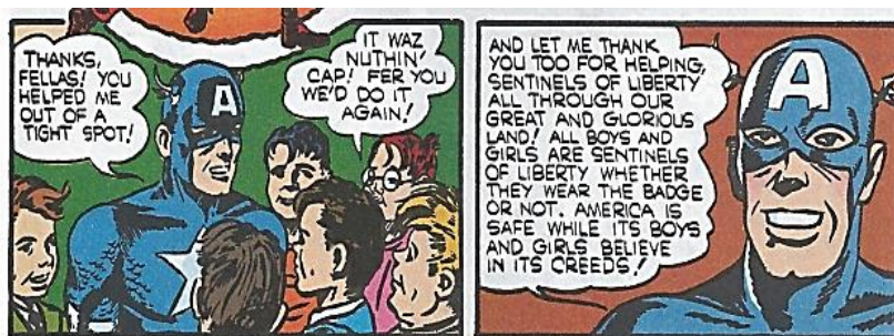
Figura 14. Simon, Joe & Kirby, Jack, Captain America #6 p. 18 (agosto, 1941), republicado en Marvel Entertainment Inc., 2009.

En las viñetas observadas (correspondientes a las figuras 11, 12, 13 y 14) se capitaliza un trabajo netamente político militante de Simon y Kirby (1941) con la invención de los “Centinelas de la Libertad” ( Sentinels of Liberty ). Se llega a esta definición en tanto que los artistas ya no sólo realizan una interpretación de los hechos a través de las aventuras antifascistas de un superhéroe, sino que buscan implementar explícitamente un tipo de ideología en la sociedad en la que pertenecen.