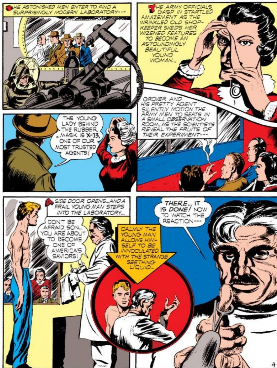
Figura 5. Simon, Joe & Kirby, Jack, Captain America #1 , p. 6 (marzo, 1941), republicado en Marvel Entertainment Inc., 2009.