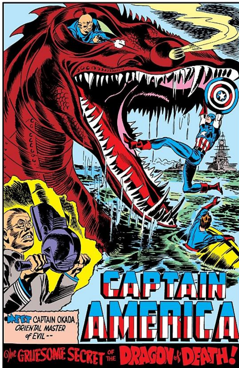
Figura 15. Simon, Joe & Kirby, Jack, Captain America #5, p. 15 (Julio, 1941), republicado en Marvel Entertainment Inc., 2009. Recuperado de: https://comicstore.marvel.com/my-books/lists

pública estadounidense en que su país debe intervenir en el conflicto, ayudar a Inglaterra y parar y destruir el exitoso avance del nazismo en Europa (Hobsbawn, 1998). Y esto es graficado por Simon y Kirby en una de las portadas de las misiones de Capitán América en julio de 1941, bajo el título: “Capitán América. ¡El horrible secreto del Dragón de la Muerte!” ( Captain America. The gruesome secret of the Dragon of Death! ):