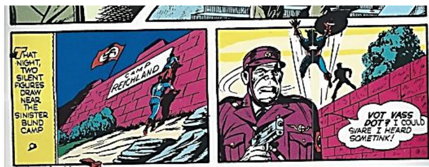
Figura 17. Simon, Joe & Kirby, Jack, Captain America #5, p. 31 (Julio, 1941), republicado en Marvel Entertainment Inc., 2009.

La última imagen analizada en esta sección, propone una tercera característica que después de la lectura de esta viñeta se hablará ampliamente.