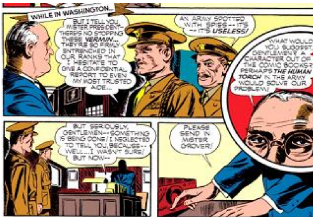
Figura 8. Simon, Joe & Kirby, Jack, Captain America #1 , p. 4 (marzo, 1941) republicado en Marvel Entertainment Inc., 2009. Recuperado de: https://comicstore.marvel.com/my-books/lists

En este sentido, Simon y Kirby, a más de poner de relieve su opinión política sobre el fascismo, también hablan sobre el régimen que gobernaba en aquel tiempo a los Estados Unidos. Por tanto, los autores formulan en el cómic una expresión política global tan sólo ya con el hecho de graficar a Franklin D. Roosevelt en el cómic.