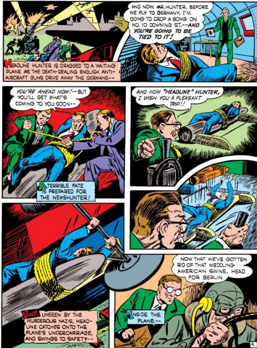
Figura 4. Lee, Stan en Simon, Joe & Kirby, Jack, Captain America #5, p. 53 (Julio, 1941), republicado en Marvel Entertainment Inc., 2009. Recuperado de: https://comicstore.marvel.com/my-books/lists

Una vez leídos los fragmentos discursivos de Roosevelt y leído las viñetas de Stan Lee en la publicación mensual de Capitán América producidas por Simon y Kirby (1941), podemos destacar varios elementos sobre el trabajo ideológico del cómic en la coyuntura del desarrollo del fascismo nacionalsocialista en el mundo.