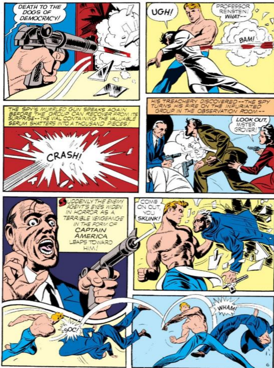
Figura 7. Simon, Joe & Kirby, Jack, Captain America #1 , p. 8 (marzo, 1941), republicado en Marvel Entertainment Inc., 2009. Recuperado de: https://comicstore.marvel.com/my-books/lists

En el primer cuadro de esta historieta, siguiendo el último de la anterior página, vemos a unos de los infiltrados nazis disparando al lugar de experimentación donde se encuentra Reinstein y Rogers. Y a la vez que dispara este “miembro de la Gestapo de Hitler” (Simon & Kirby, 1941)