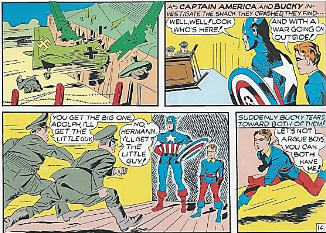
Figura 16. Simon, Joe & Kirby, Jack, Captain America #2 , p. 31 (abril, 1941), republicado en Marvel Entertainment Inc., 2009. Recuperado de: https://comicstore.marvel.com/my-books/lists

En esta viñeta hay que poner atención en el tercer cuadro donde Adolf Hitler y Hermann Goebbels corren para atacar a Capitán América y Bucky, que los esperan con calma dispuestos al enfrentamiento. En este cuadro leemos que tanto Hitler como Goebbels quieren atacar a Bucky, el más pequeño y por ende el más débil, en comparación con Capitán América, y que los altos mandos nazistas tienen miedo a enfrentarse a este superhéroe.