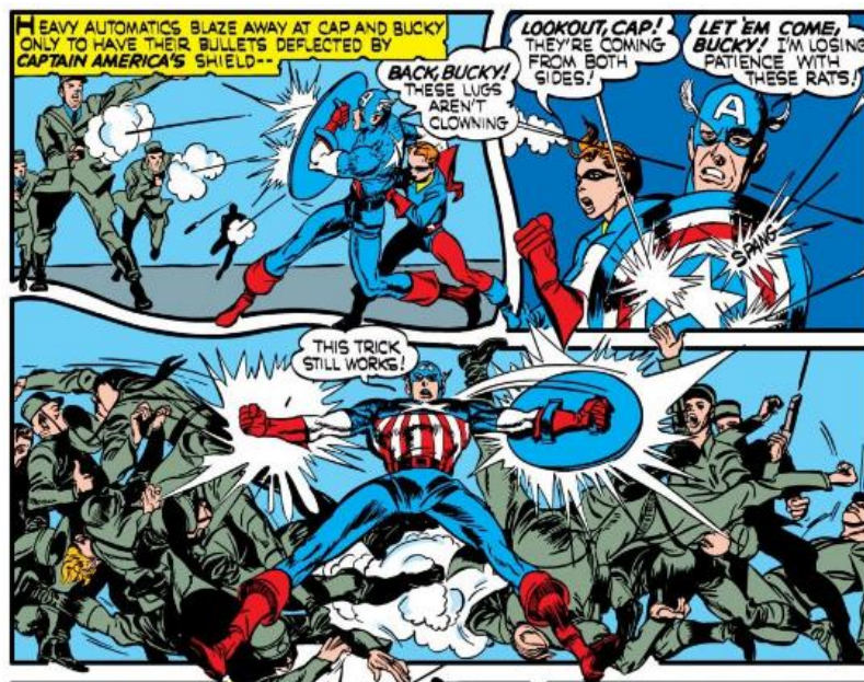
Figura 10. Simon, Joe & Kirby, Jack, Captain America #5, p. 35 (julio, 1941), republicado en Marvel Entertainment Inc., 2009.

La viñeta que se muestra a continuación reafirma lo analizado en los párrafos anteriores porque se observa a Capitán América combatiendo a un grupo de seguidores fascistas, que los va derrotando tan sólo con el uso de su escudo.