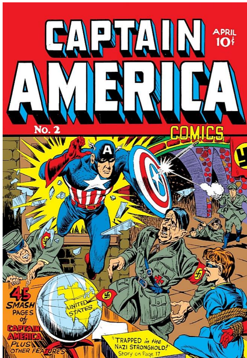
Figura 2. Simon, Joe & Kirby, Jack, Captain America #2 (abril, 1941), republicado en Marvel Entertainment Inc., 2009.

Recuperado de: https://comicstore.marvel.com/my-books/lists