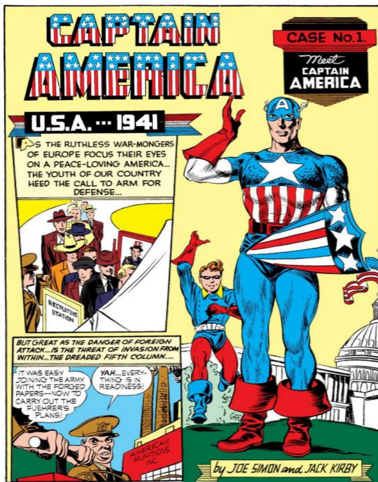
Figura 9. Simon, Joe & Kirby, Jack, Captain America #1 , p. 3 (marzo, 1941), republicado en Marvel Entertainment Inc., 2009. Recuperado de: https://comicstore.marvel.com/my-books/lists

En este sentido, cualquier enfrentamiento bélico entre los “amantes de la paz” y los “agresores” (Roosevelt, 1937) tendrá como fin único la defensa del sistema democrático que sustenta, según Roosevelt (1941), un modo de vida adecuado para el desarrollo de capacidades individuales y sociales dentro de estas sociedades. En este sentido, ahora es menester indicar páginas del cómic que grafican las palabras del Presidente como la forma correcta de actuar frente al nazismo.