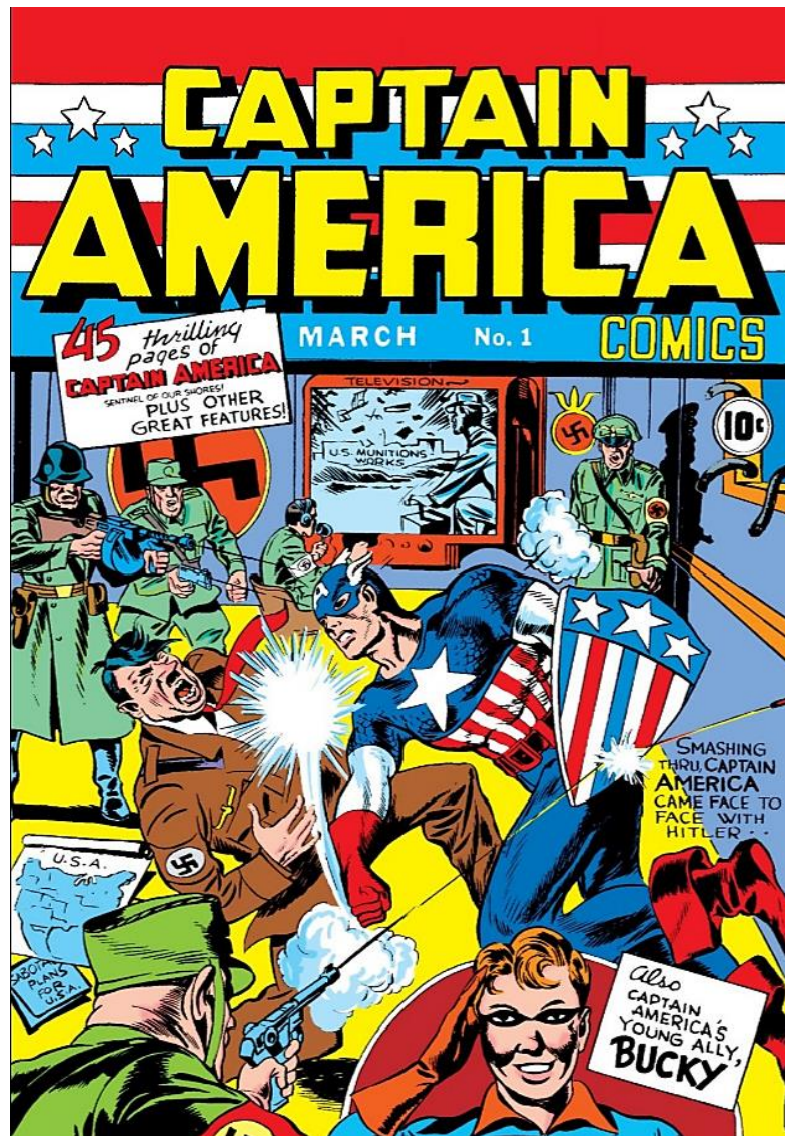
Figura 1. Simon, Joe & Kirby, Jack, Captain America #1 (marzo, 1941), republicado en Marvel Entertainment Inc., 2009. Recuperado de: https://comicstore.marvel.com/my-books/lists

Nunca había existido un verdadero villano creíble en los cómics. Pero Adolfo (Hitler) estaba vivo, odiado por más de la mitad del mundo. Como un frustrado natural que era, con su cómico mostacho, el ridículo remolino, su fanfarronería, el paso de ganso de sus subalternos ansiosos por saltar de un avión si su demente líder les ordenará, después del saludo de brazo rígido Heil Hitler, por supuesto. Yo oler un ganador. Todo lo que se hizo fue idear un héroe de calzoncillos largos para hacerle frente.