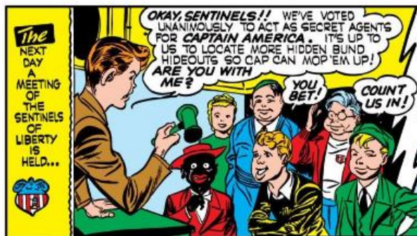
Figura 12. Simon, Joe & Kirby, Jack, Captain America #5 , p. 36 (Julio, 1941), republicado en Marvel Entertainment Inc., 2009. Recuperado de: https://comicstore.marvel.com/my-books/lists