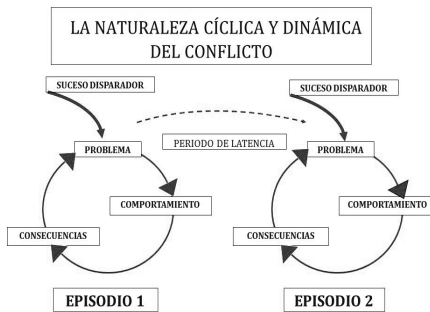
Tabla N° 15 Diagnóstico de los conflictos interpersonales

Los conflictos interpersonales son cíclicos pues las personas solo entran periódicamente en conflicto. En un determinado lapso, los problemas existentes entre ellas constituyen un conflicto latente. Luego, por cualquier razón, el conflicto cobra vigencia, los participantes experimentan las consecuencias de su trato mutuo y posteriormente se hará nuevamente menos notorio.