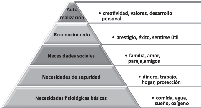
Tabla N° 6 Pirámide de Maslow

Inicialmente la jerarquización consideraba la condición de ascender la pirámide en forma progresiva, situación que no se cumple. Se pueden satisfacer simultáneamente varias motivaciones o algunas de ellas sin esperarse una regularidad en el proceso. No obstante, las condiciones socioeconómicas marcan también diferencias en el cumplimiento de esta teoría, así en países del primer mundo se encuentra un mayor número de habitantes con satisfacción de necesidades básicas y seguridad, mientras que en países en vías de desarrollo o del tercer mundo no se satisfacen aún los niveles inferiores en la mayoría de la población. La investigación psicológica contemplará no solo las necesidades individuales de los sujetos,