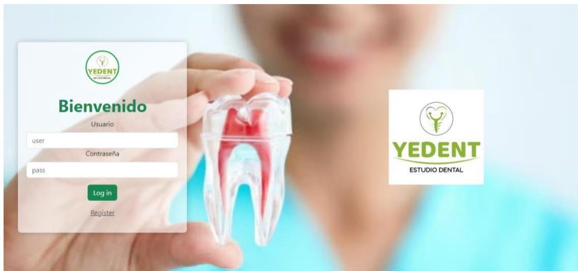
Figura 3: Interfaz

Pagos: Información sobre los pagos realizados por los pacientes, incluyendo montos, métodos de pago y saldos pendientes.