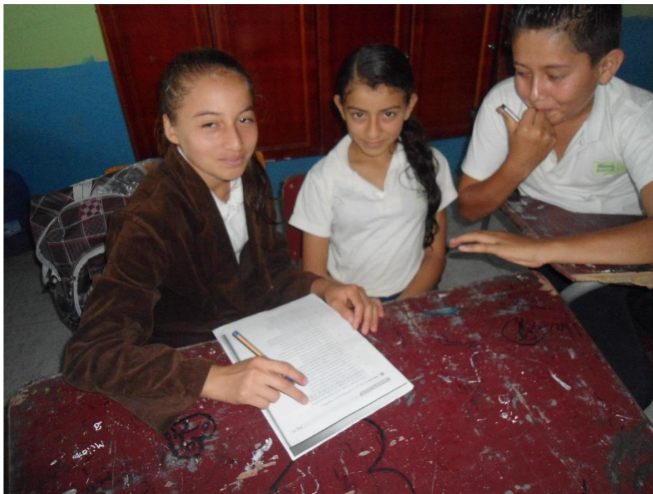
Trabajo grupal de refuerzo, sobre la clase impartida de ortografía con alumnos de 7mo. Año Básico.