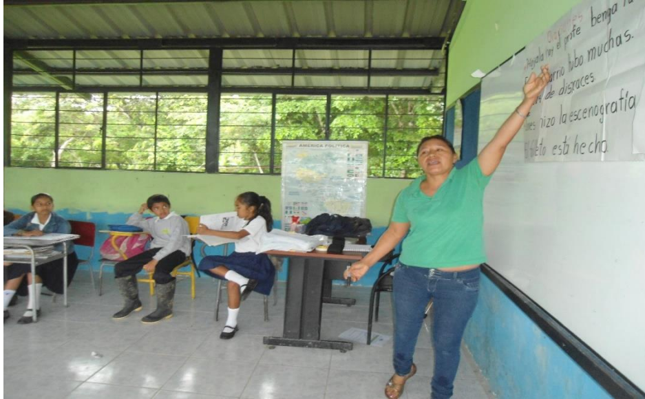
Docente impartiendo las clases de Ortografía.