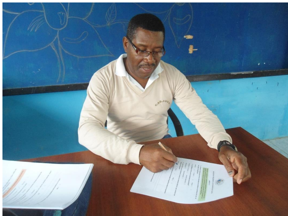
Maestro de Estudios Sociales efectuando la encuesta.