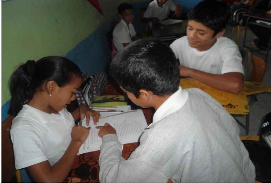
Trabajo grupal de refuerzo, sobre la clase impartida de ortografía con alumnos de 6to. Año Básico.