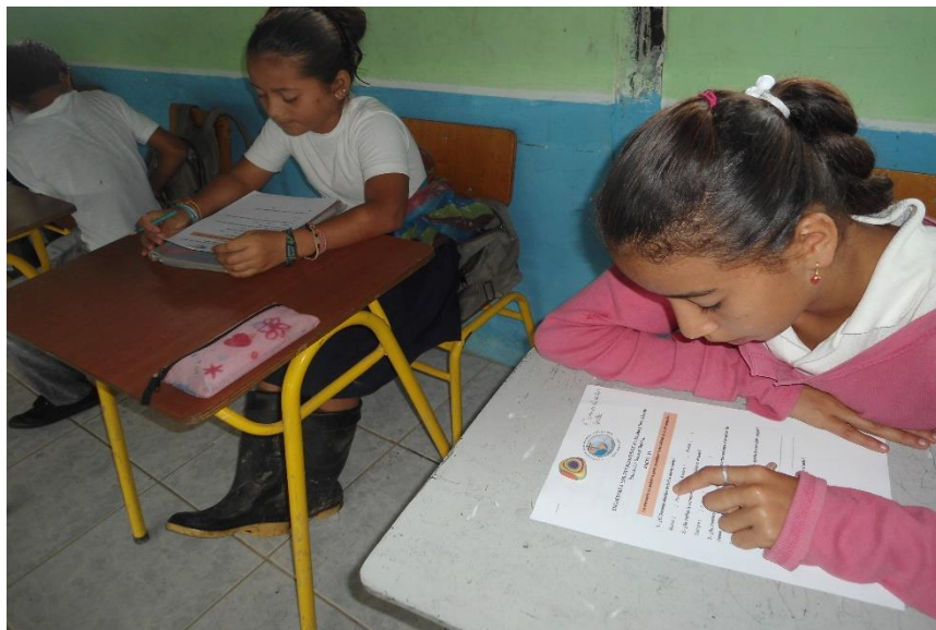
Desarrollo de la encuesta por parte de los estudiantes de 6to. Año Básico