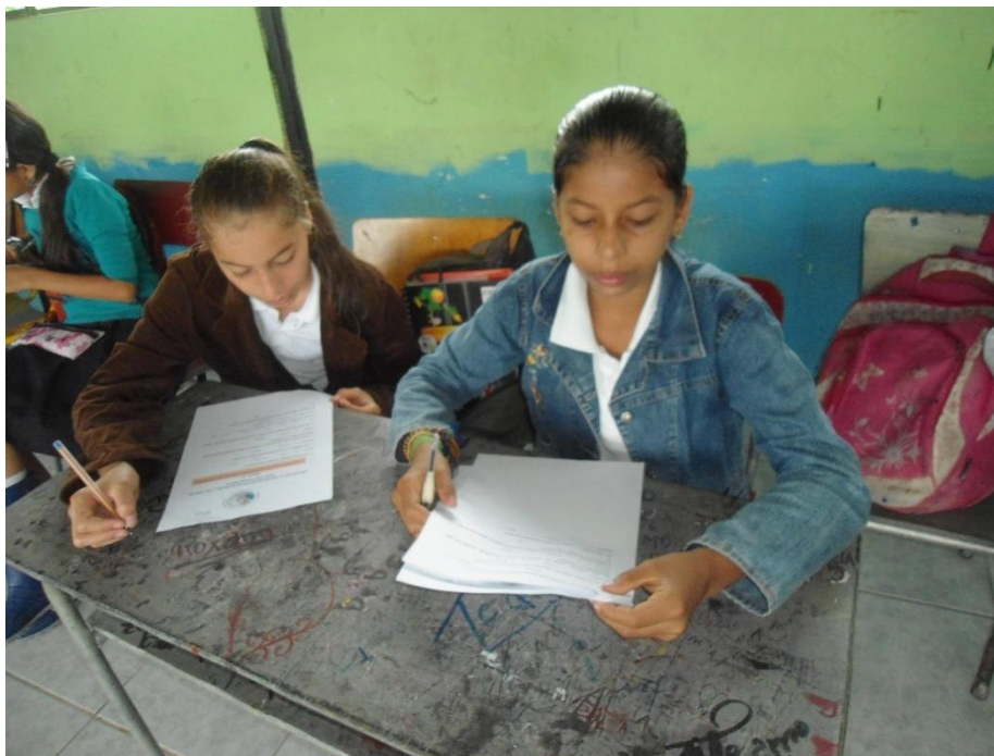
Participación en la encuesta de los alumnos de 7mo. Año Básico