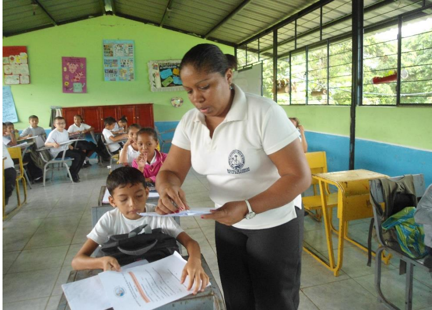
Entrega y socialización de las encuestas con alumnos de 6to. Año Básico