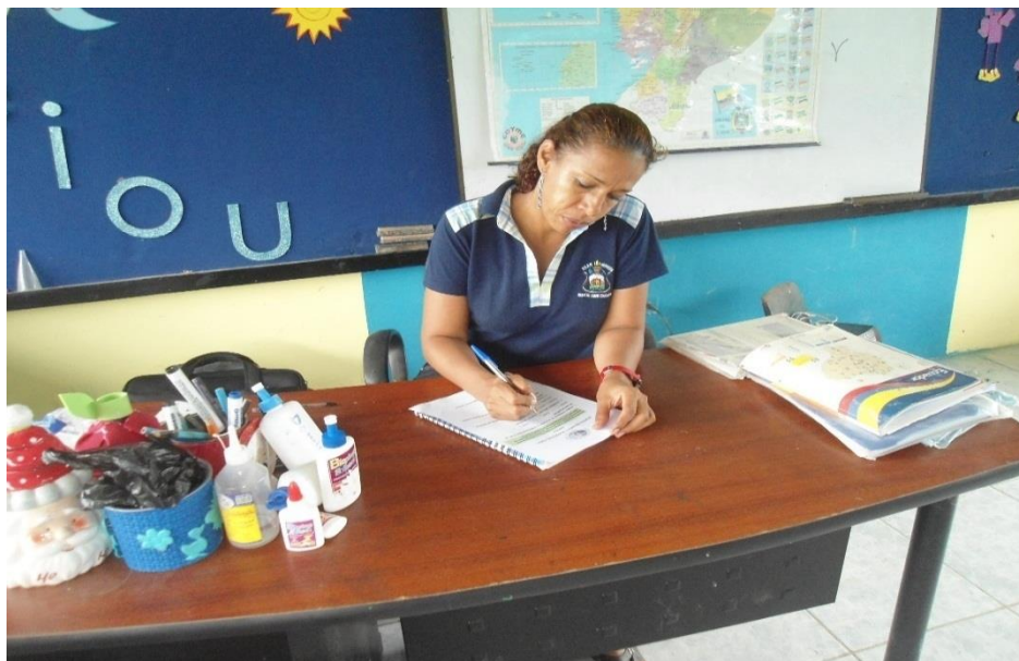
Docente de Lengua y Literatura realizando la encuesta.