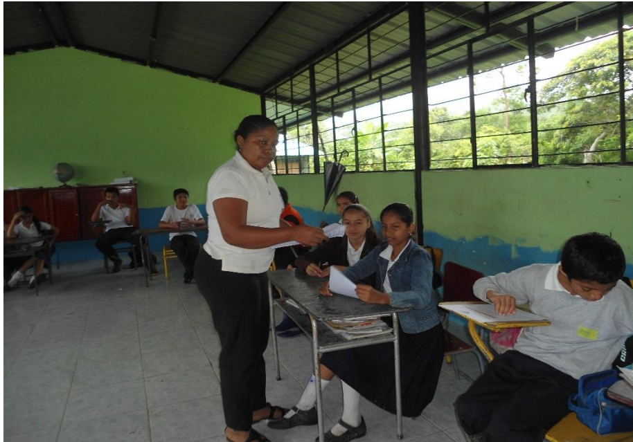
Entrega de encuesta a los alumnos de 7mo Año Básico