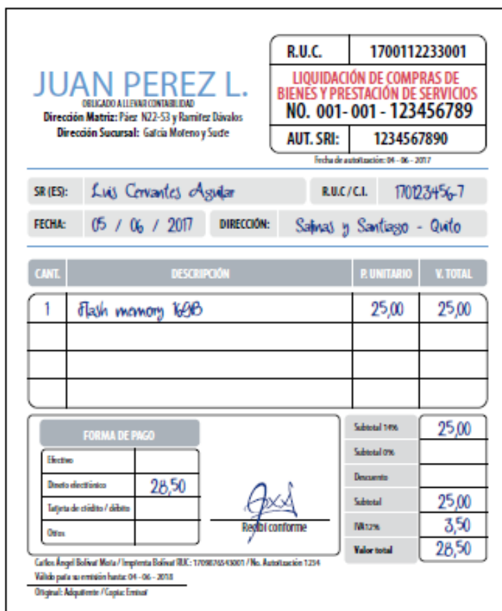
Gráfico No. 8. Registro Liquidación de Compras.