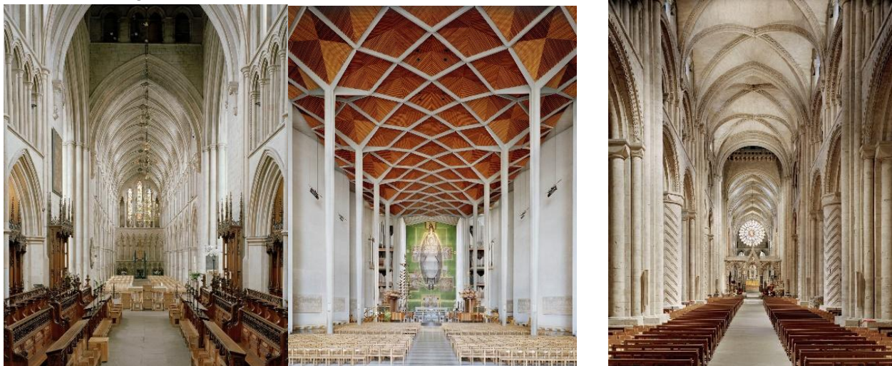
Trabajo Fotográfico “The English Cathedral” (2012) tomado de: La catedral inglesa

Peter Marlow (1952-2016) fue un reconocido fotógrafo británico y miembro de la agencia Magnum, celebre por su capacidad para capturar la serenidad y la esencia de los espacios arquitectónicos. Su enfoque combina un estilo documental preciso con una sensibilidad artística excepcional, creando imágenes que resaltan tanto la monumentalidad como el entorno espiritual de los lugares religiosos.