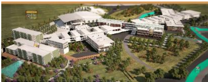
Gráfico 1 Tachina Pucese