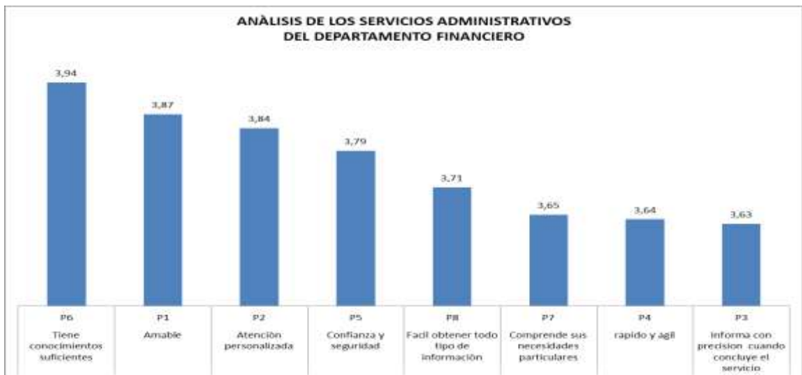
Figura 1: Departamento Financiero