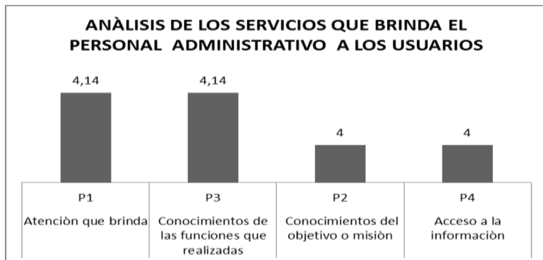
Figura 4: Departamento Financiero; Secretaría General; Centro de producción y Biblioteca.