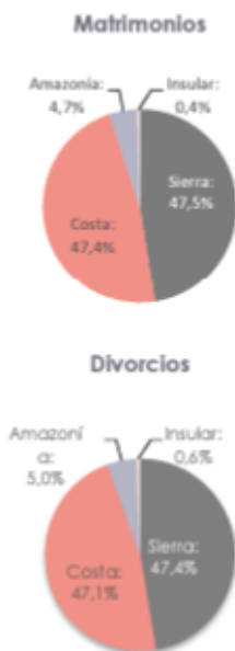
Gráfico 2 Matrimonios y Divorcios