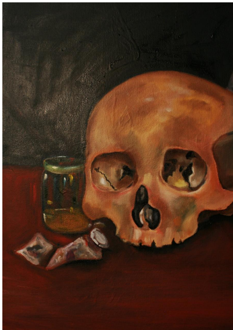
Emilia Egas, Polvo eres..., 2016