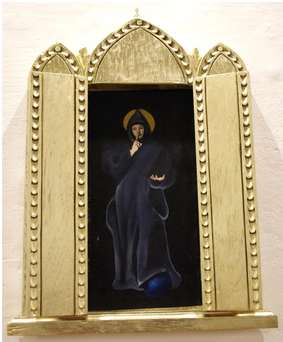
Emilia Egas, San Clascuro, 2016