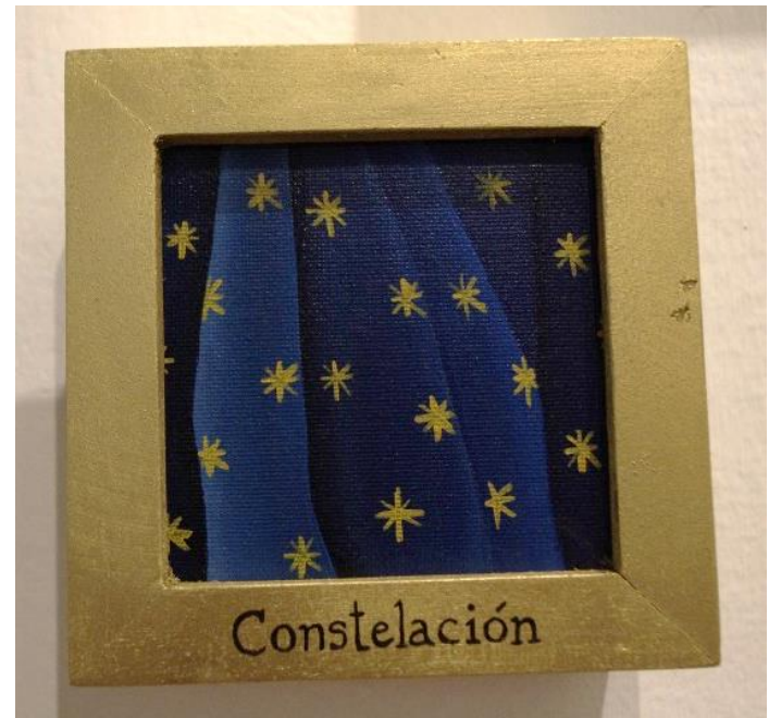
Emilia Egas, Iconografías, 2016