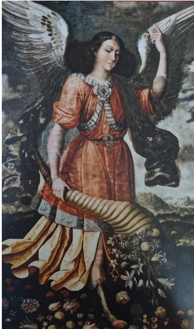
Anónimo, Arcángel San Gabriel, S.XVII