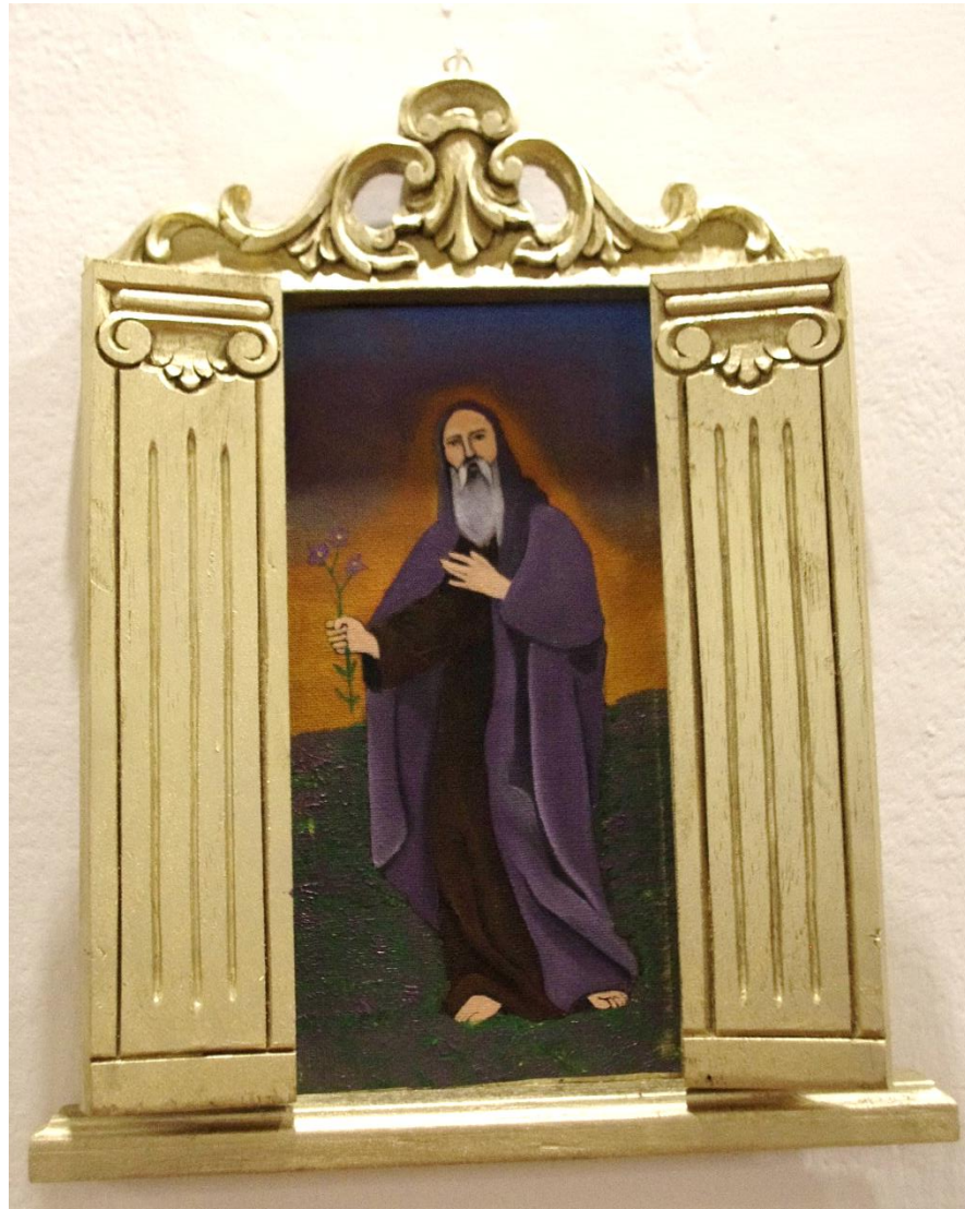
Emilia Egas, San Óleo, 2016