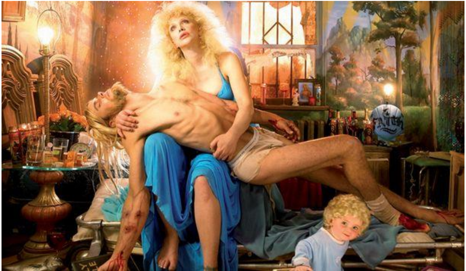
David LaChapelle, Heaven to Hell, 2006