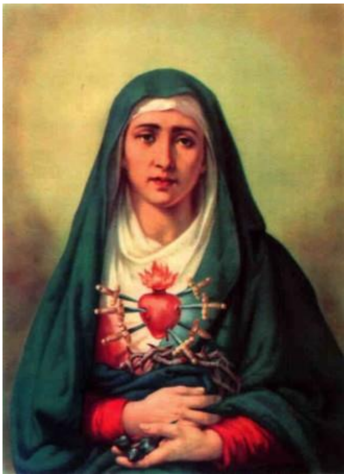
Anónimo, Virgen la Dolorosa