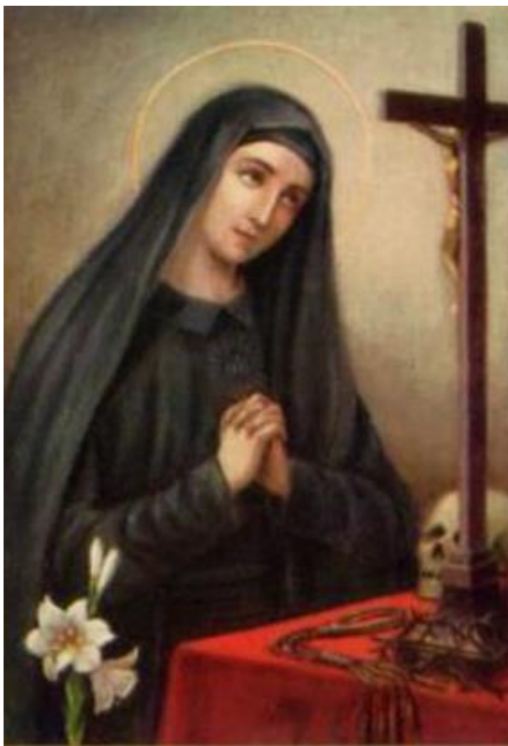
Anónimo, Santa Mariana de Jesús, S. XVIII