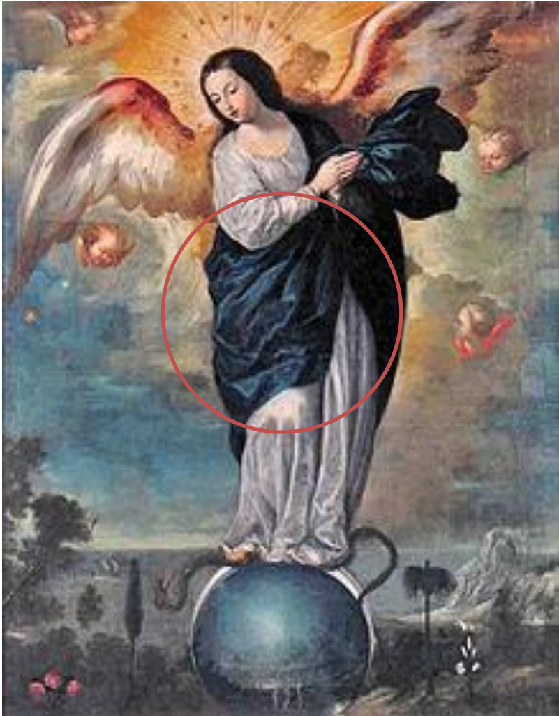
Miguel de Santiago, Virgen alada del Apocalipsis, S.XVII