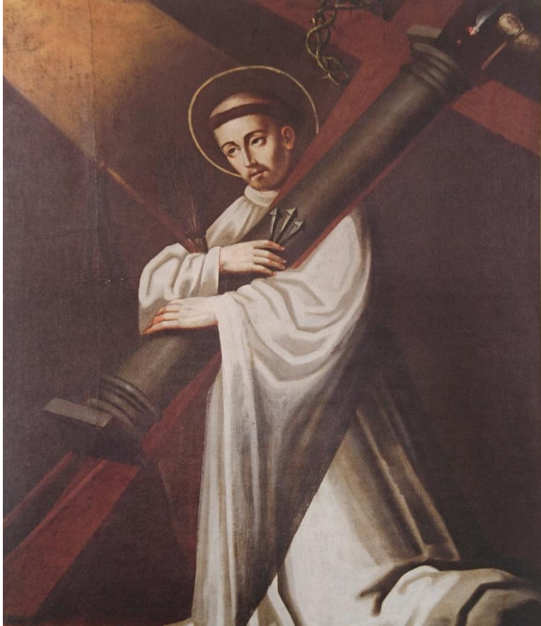
Escuela Lino Baldassari, Bernardo de Claravajal, 1887