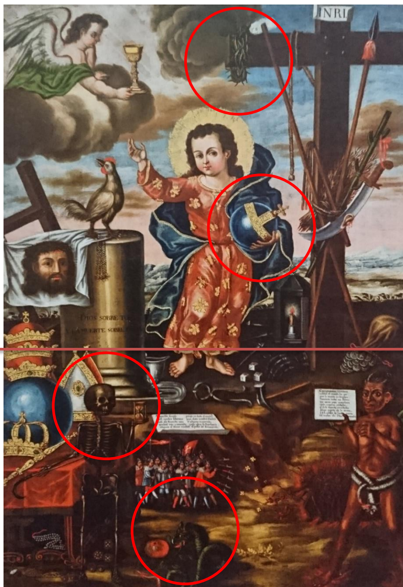
Anónimo, Dulce nombre de Jesús, S.XVIII