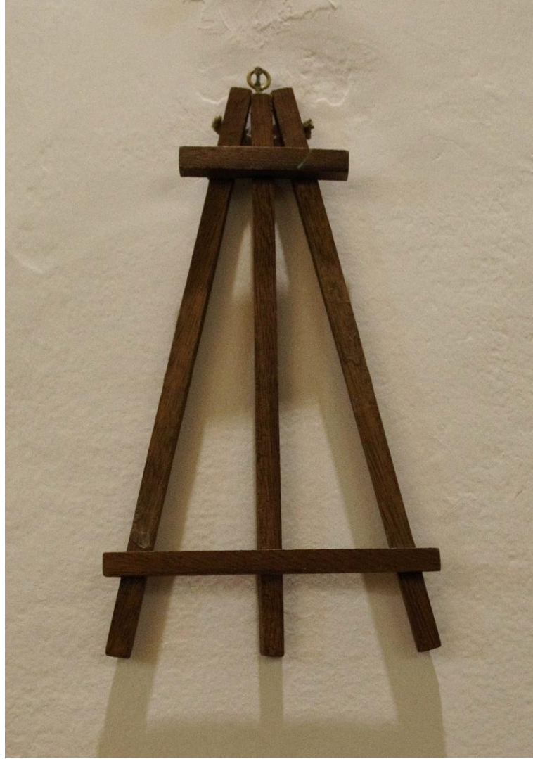
Emilia Egas, Cruxifixus, 2016