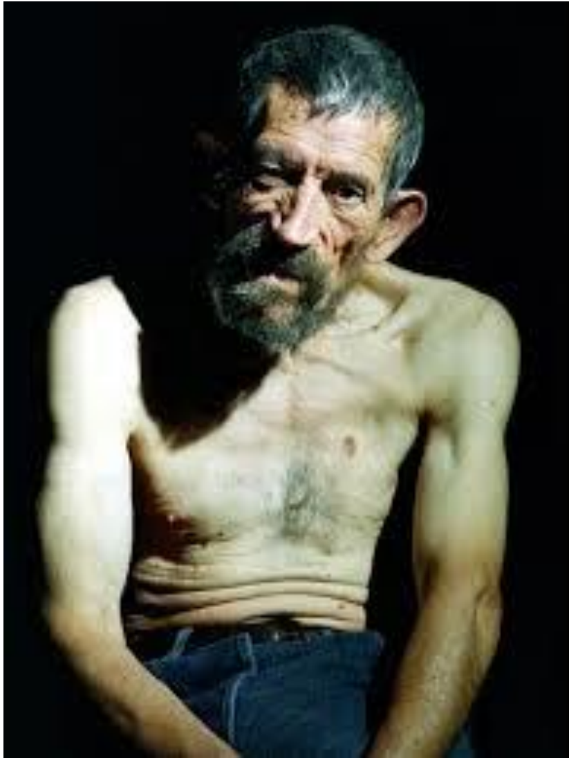
Pierre Gonnord, El Hurgador, 2007