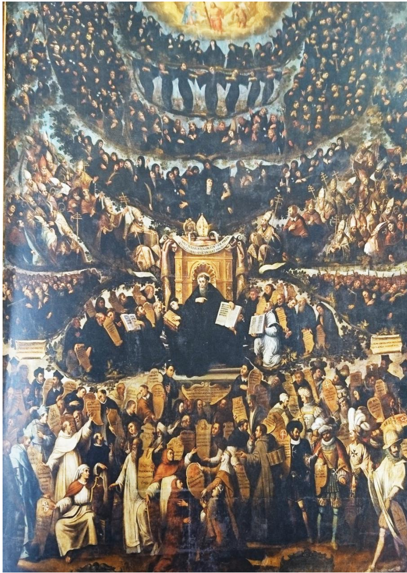
Miguel de Santiago, La genealogía o regla de San Agustín. O "de las mil caras", 1658