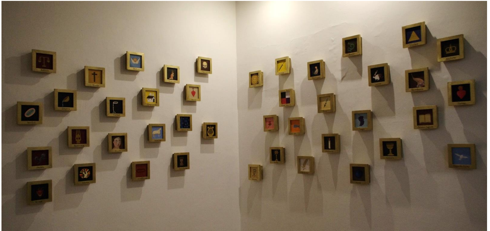
Emilia Egas, Iconografías, 2016