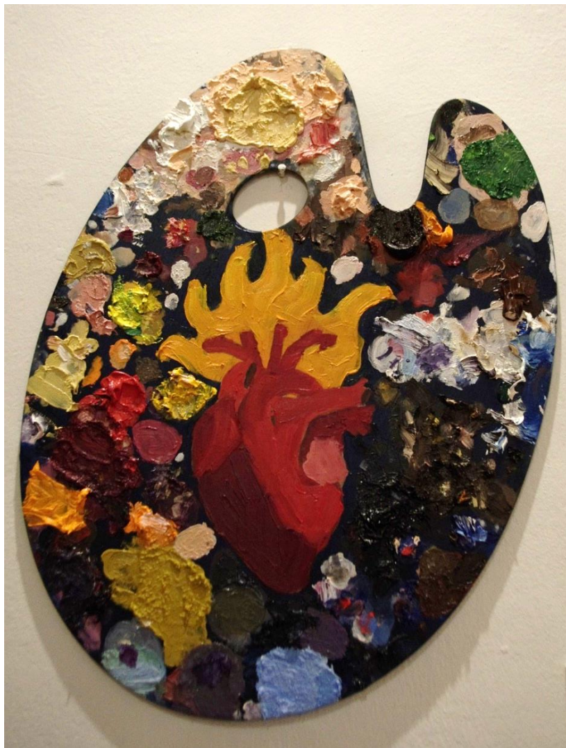
Emilia Egas; S/Título, 2016