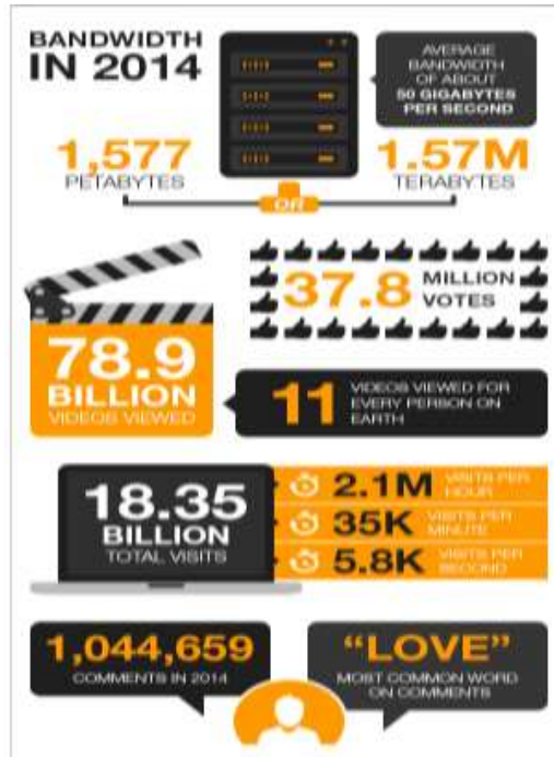
IMAGEN N°1 PORNHUB 2014 AÑO EN REVISIÓN