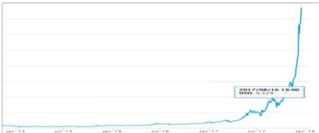
GRÁFICO N°1 EVOLUCIÓN DEL PRECIO DE MERCADO DE BITCOINS EN RELACIÓN A DÓLARES AMERICANOS USD