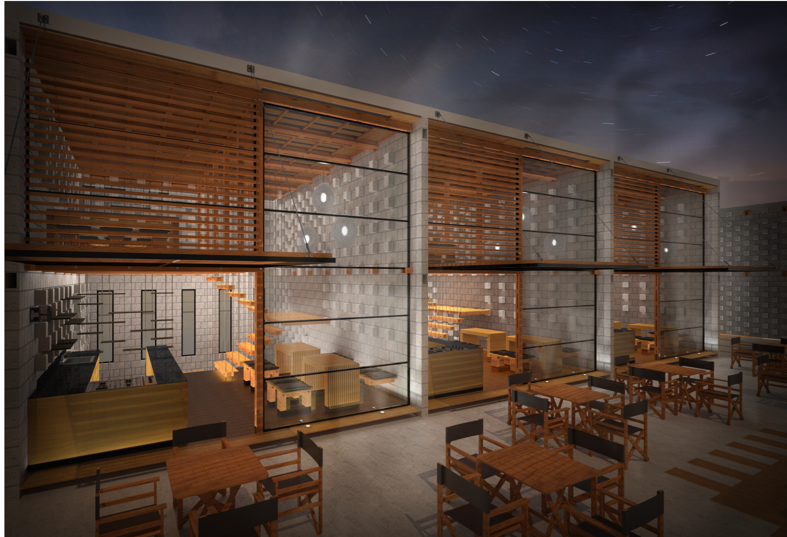
LOCALES + BOULEVARD + ESTACIONAMIENTO