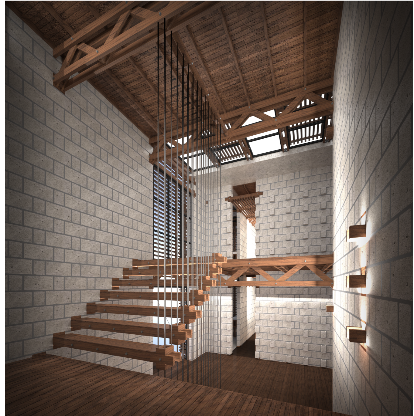
INTERIOR SERVICIOS GRADAS