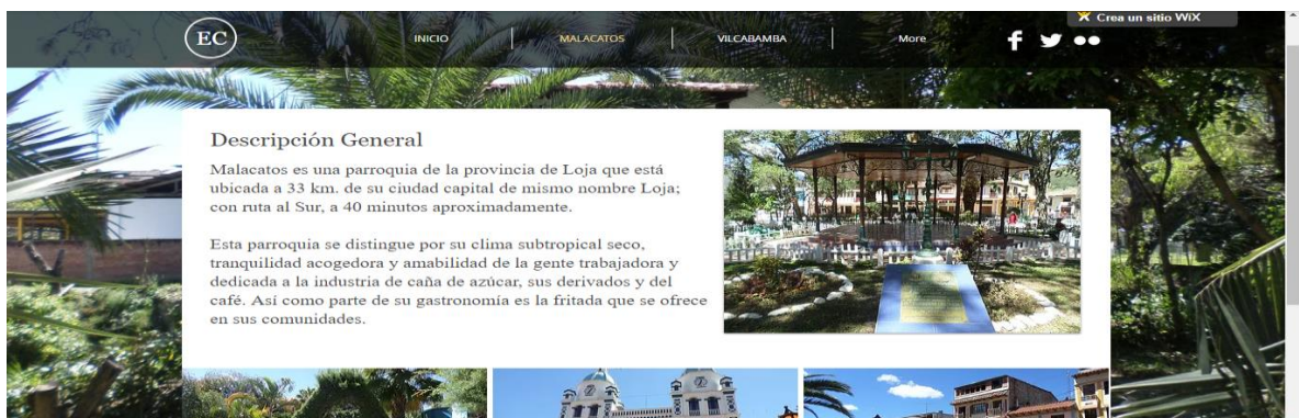
Imagen 2. Descripción general de Malacatos