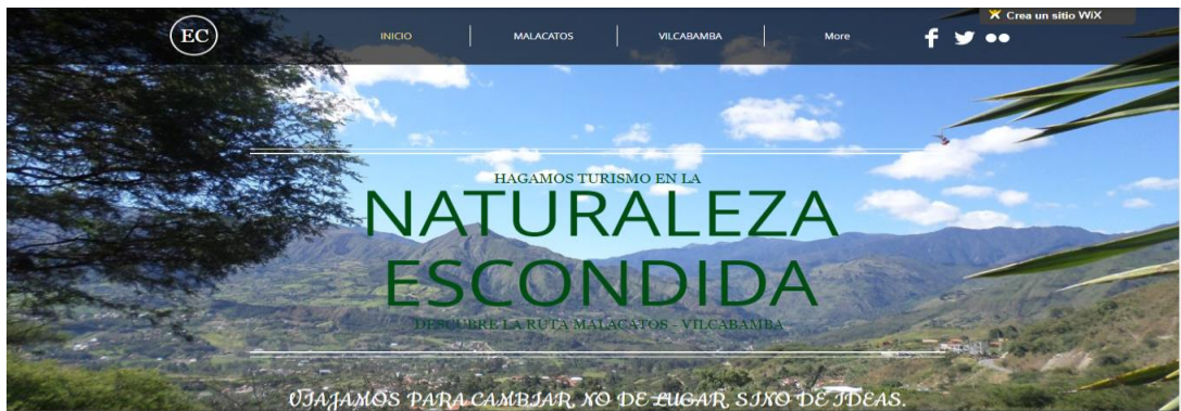
Imagen 1. Naturaleza escondida.