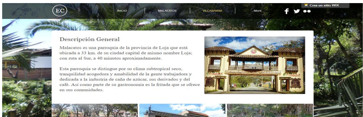
Imagen 3. Malacatos