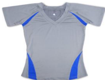
IMAGEN N. 3 JERSEY CURVES

Fuente: www.curveslatinoamerica.com Elaborado por: Curves Latinoamérica.