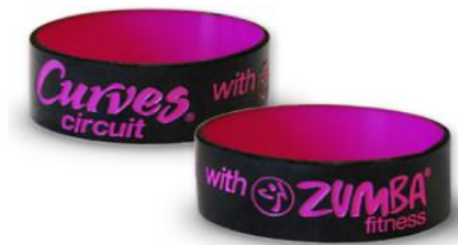
IMAGEN N. 4 PULSERA CURVES CIRCUIT WITH ZUMBA

Fuente: www.curveslatinoamerica.com Elaborado por: Curves Latinoamérica.