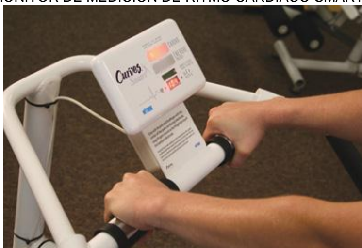
IMAGEN N. 11 MONITOR DE MEDICION DE RITMO CARDIACO SMART