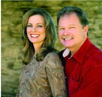
IMAGEN N. 2 GARY HEAVIN Y DIANE HEVIN