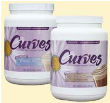
IMAGEN N. 6 BATIDOS CURVES