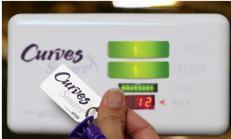
IMAGEN N. 10 MONITOR, TARJETA DE ENTRENAMIENTO CURVES SMART

Fuente: www.curveslatinoamerica.com Elaborado por: Curves Latinoamérica.