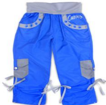
IMAGEN N. 5 PANTALON CARGO CURVES

Fuente: www.curveslatinoamerica.com Elaborado por: Curves Latinoamérica.