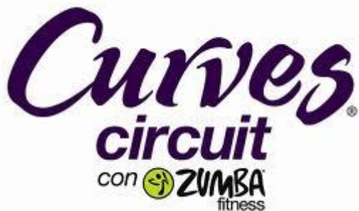
IMAGEN N. 13 LOGO CURVES CIRCUIT CON ZUMBA FITNESS

Fuente: www.curveslatinoamerica.com Elaborado por: Curves Latinoamérica.