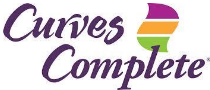
IMAGEN N. 9 LOGO CURVES COMPLETE

Fuente: www.curveslatinoamerica.com Elaborado por: Curves Latinoamérica.