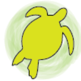
Imagen 3: Isotipo