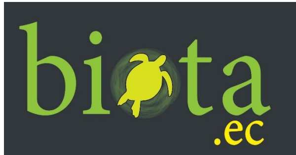
Imagen 2: Logotipo